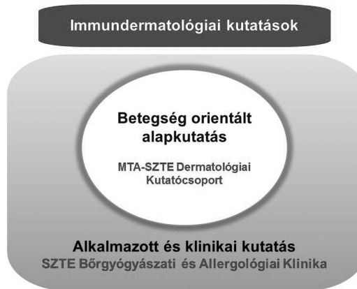
1. ábra. Az SZTE ÁOK Bőrgyógyászati és Allergológiai Klinikán folyó kutatások.

A bőrgyógyászatban évtizedekig szinte kizárólag a morfológiai szemlélet uralkodott. A szegedi bőrklinikán a tudományos kutatásokban áttörő változást eredményezett, amikor a Simon Miklós vezetése alatt álló klinikán Dobozy Attila a nemzetközi trendeknek megfelelően bevezette a funkcionális dermatológiai kutatásokat, melynek fókuszában a bőr immunológiai funkciójának megértése állt. Nagy változást hozott a klinika életében, amikor Dobozy Attila akadémiai kutatócsoport megalapítására nyert el támogatást és 1999-ben vezetésével megalakult az MTA-SZTE Dermatológiai Kutatócsoport. A kutatócsoport vezetését 2007-től Kemény Lajos vette át. A Kutatócsoport keretében az Akadémia alkalmazásában álló kutatók és a klinika munkatársai közösen végzik munkájukat, melynek elsődleges célja a multifaktoriális bőrbetegségek hátterében álló genetikai és molekuláris folyamatok megértése (1. ábra).