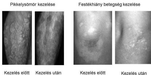
3. ábra. A 308 nm XeCl excimer lézer terápiás alkalmazási lehetőségei.