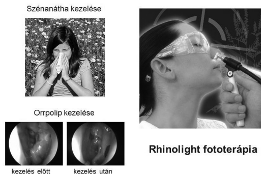
4. ábra. A fényterápia új alkalmazási lehetőségei.

Túlzás nélkül állítható, hogy a bőrgyógyászati fényterápiában az elmúlt 20 év legnagyobb áttörését az általunk kifejlesztett célzott UV-B fényterápiás készülékek kifejlesztése jelentette. Ezen innovatív orvostechikai eszközök segítségével flexibilis száloptikán keresztül nagyenergiájú koherens (lézer) vagy inkoherens UV-B fény juttatható a kezelni kívánt bőrterületre. A léziók célzott kezelése révén a környező ép bőrterületet nem éri az esetlegesen károsító sugárzás. Emellett a pikkelysömörös lézióknak megfelelően kiszélesedett hámterületeken nagyobb – a MED többszörösének megfelelő – UV-B dózis alkalmazható, mint a környező ép bőrterületen, így gyorsabban érhető el a tünetmentesség. A XeCl lézer optikai tulajdonságainak (308 nm-es, nagyenergiájú, monochromatikus, koherens UV-B fény emissziója), valamint a száloptikán alapuló fénytovábbító rendszernek az ötvöztetésével olyan berendezés született, amellyel különböző bőrbetegségekben eredményesen végezhető lokális UV-B fénykezelés. A célzott fototerápiával megvalósítható olyan testtájak – például a hajas fejbőr vagy a száj- és az orrnyálkahártya – kezelése is, melyek a hagyományos fluoreszkáló fényforrással rendelkező berendezésekkel nem érhetőek el, ami egyúttal a fototerápia indikációs körének bővüléséhez vezethet.