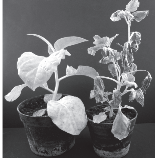
3. ábra. C. nicotianae tünetei 8 hetes N. tabacum (bal oldali növény) és 9 hetes N. benthamiana (jobb oldali növény) levelein 7 nappal az inokuláció után

Megvizsgáltuk, hogy a levelekre permetezéssel kijuttatott növényi növekedésszabályzó anyagok, vagy ezek bioszintézisének inhibitorai képesek-e a C. nicotianae által okozott tüneteket módosítani N. benthamiana gazdanövényen. A szalicilsavval analóg acibenzolar-S-metil (korábbi elnevezése benzotiadiazol) és az etilén bioszintézisét gátló amino-etoxi-