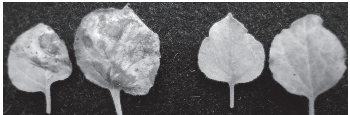
1. ábra. Cercospora nicotianae által okozott tünetek Nicotiana benthamiana leveleken 7 nappal az inokuláció után. (A jobb oldali két levél azonos korú egészséges növényről származik.)

ció utolsó 24 órájában) először az alsó leveleken váltak láthatóvá a tünetek. Ezek kezdetben apró nekrotikus léziók voltak, melyek fokozatosan, napról-napra növekedtek. Az is megfigyelhető volt, különösen idősebb leveleken, hogy a tünetek egyszerre jelentek meg egy nagyobb, több mm átmérőjű foltban. A tünetek a következő 4–5 napon látványosan erősödtek. Újabb és újabb léziók jelentek meg, melyek összefolytak (1. ábra), s megjelentek a tünetek a növény fiatal felső levelein is. A nagyobb átmérőjű léziók esetén volt megfigyelhető, hogy a központi részükből konídiumképződés indult ki nedves körülmények között. Ha ezeket a nagyobb nekrotikus foltokat tartalmazó leveleket 3 napra nedveskamrába helyeztük, a levél színén és fonákán egyaránt megjelent a sporuláló gomba sűrű szövedéke (2. ábra), ami PDA táptalajra oltva a C. nicotianae telepeire jellemző morfológiájú telepeket adott. Ezekből a tenyészetekből konídiumszuszpenziót készítve az első inokuláció esetében tapasztalt tünetekkel azonos tüneteket kaptunk a N. benthamiana levelein.