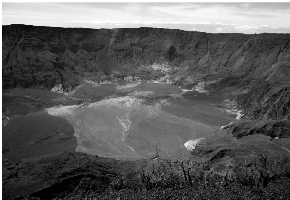
3. ábra • A Tambora hatalmas, égbe nyíló szája, a vulkánkitörést követően visszamaradt széles kaldera részlete (fotó: Katie Preece, University of East Anglia)

óra alatt több kén-dioxid zúdult a légterbe, mint Európában tíz év alatt! A Föld globális kén-dioxid-kibocsátása a 2006-os igen magas szennyezési időszakban sem érte el a 33 millió tonnát! A magaslégtérben lévő kénsavaeroszol-felhő visszaveri a Nap sugarait, és elnyeli a Földről érkező infravörös sugárzást, aminek az eredménye egyrészt az, hogy a földfelszín hőmérséklete lecsökken, a sztratoszféra viszont felmelegszik, ami alaposan megváltoztatja a magasban zajló légközést, és többek között befolyásolja a monszont is. Egy trópusi területen bekövetkező ilyen nagyságú vulkánkitörés következményei pedig már globálisak. Ez a hatalmas kén-dioxid-kibocsátás járult hozzá az 1816-as „nyár nélküli évhez”, az 1810-es évek második felének anomális időjárásához, amikor a globális átlaghőmérséklet több mint 1°C-kal csökkent.