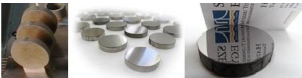
1. ábra Előkészített próbatetek

A vizsgálatokhoz korong alakú próbatesteket készítettünk (átmérő: 30 mm, magasság: 5,5 mm). Az azonos vizsgálati feltételek biztosítása érdekében a próbatesteket felület előkészítést (csiszolás, polírozás) ugyanazon paraméterek mellett végeztük (1. ábra).