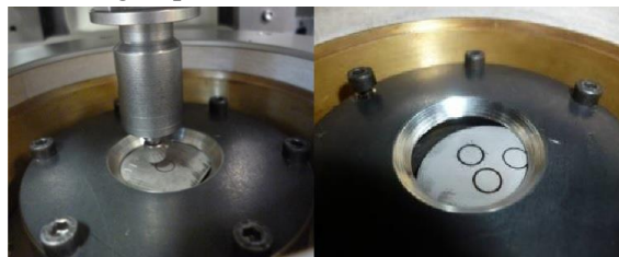
2. ábra Koptatott próbatetek

A próbatetek felületi keménység értékeit a koptató vizsgálat megkezdése előtt ellenőriztük. A két maraging acél keménysége 590 HV10 a Vanadis 6 acél keménysége 820 HV10 volt. A koptató vizsgálat során a berendezésbe befogott próbatestről készített felvételek a 2. ábrán láthatók.