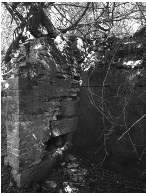
4. ábra – Az Enyődi-malom 2012-ben