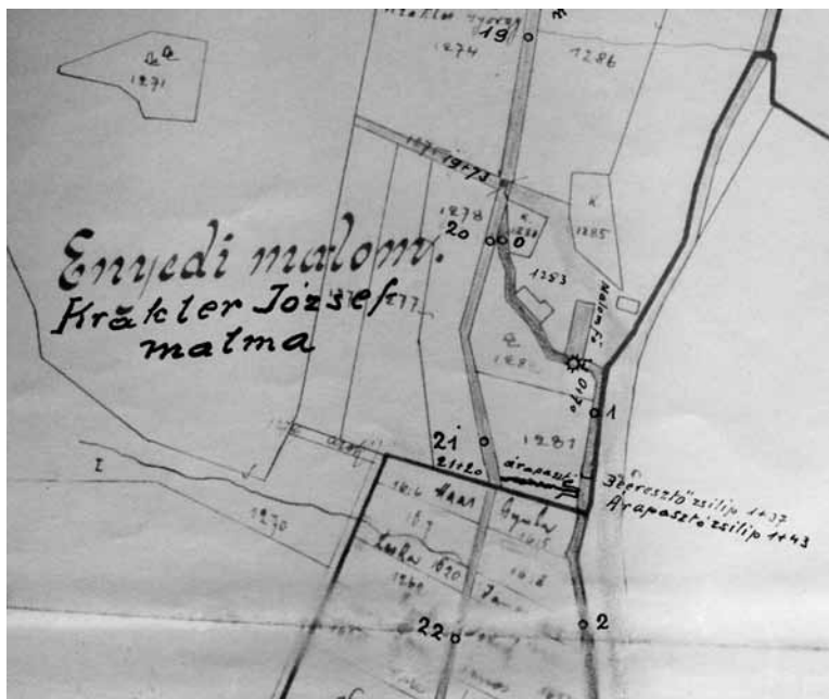
2. ábra – Az árkos rendszerű Enyődi-malom (Krackler-malom) műszaki ábrázolása 1929-ből. (Krackler József kerceselgeti vízimalmának terve, helyszínrajz. Környezetvédelmi és Vízügyi Levéltár VI. 12. b. 246d. 110. cs)