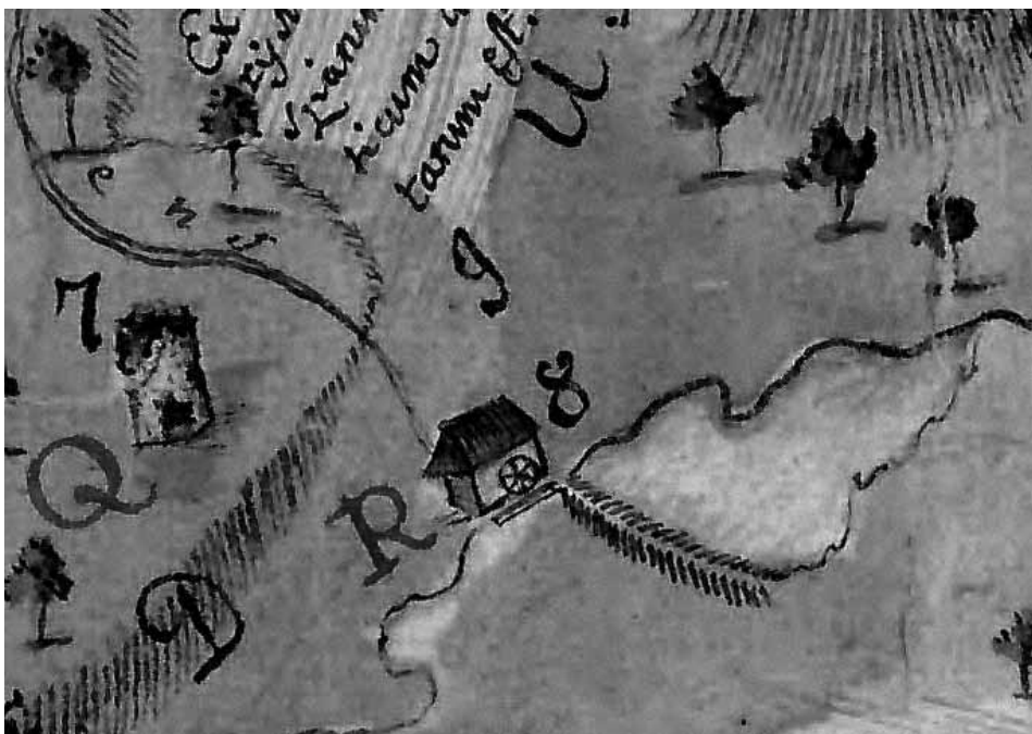
1. ábra – A malomtavas rendszerű Enyődi-malom ábrázolása 1759-ből. MNL Az Esterházy és Eszterházy családok térképei, terurajzai. Arcanum, DVD-kiadvány, 2009. S016. No 155.