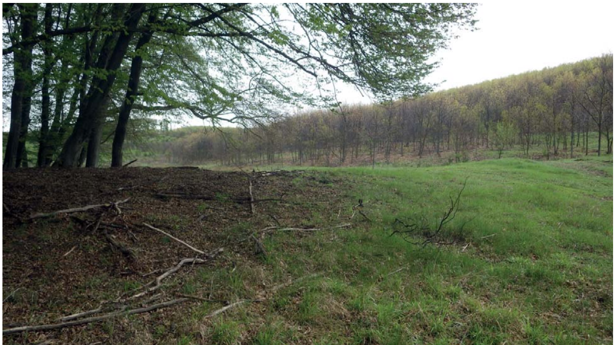
3. ábra. Középkori halastó gátja Töl kolostora közelében (Gyulaj, Marczin-kút)

1486-ban két berki (ma Nagyberki, Somogy megye) nemes egy halastavat a rajta álló malmokkal együtt a szentpáli