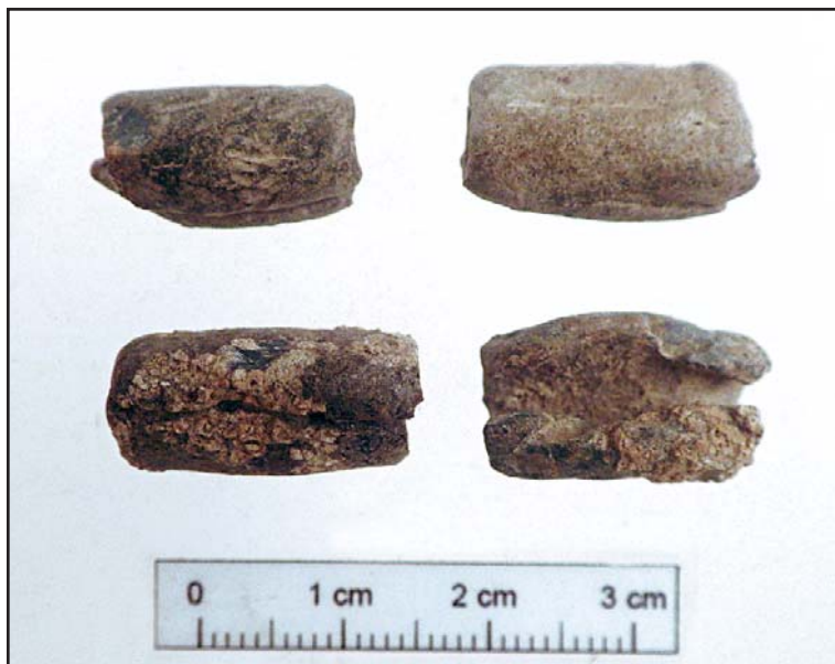
4. kép. Ólom hálónehezékek Bölske, Porong lelőhelyről