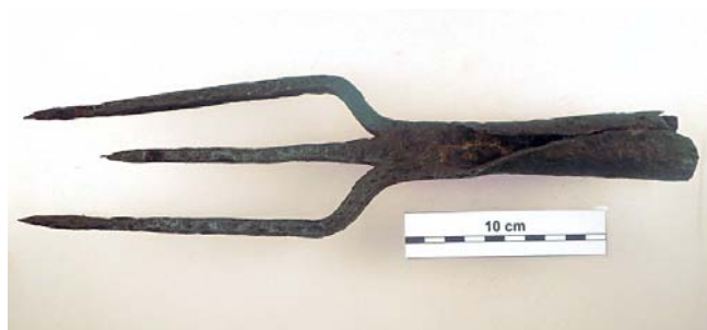
1. kép. Háromágú vasszigony a középkori Alegres falu helyéről (Pálfa, Hidi-dűlő)

és haltizedét a szekszárdi szandzsák 1574 és 1595 közé keltezett tímár javadalom-jegyzéke is említi. 23 A bátaiak 1619-ben 8 szárított halat, 1636-ban 4, 1674-ben 4 halat adtak a bátai apátnak. 24 A középkori plébániatemplom építőanyagát is magába foglaló, 18. századi városháza bontási törmelékéből az 1990-es években két lyukkal átfúrt, lapos hálonehezék került elő. 25