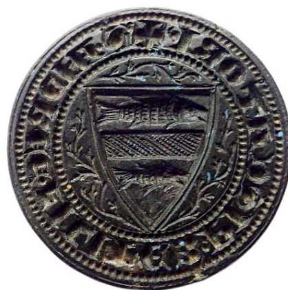
5. kép. Halas címerrel díszített pecsénnyomó Nagykónyi határából

kolostornak adott. 183 Az oklevélből nem derül ki, hogy pontosan hol volt a halastó, berki és pusztakárai (ma Kára, Somogy megye) adományok között szerepel a felsorolásban.