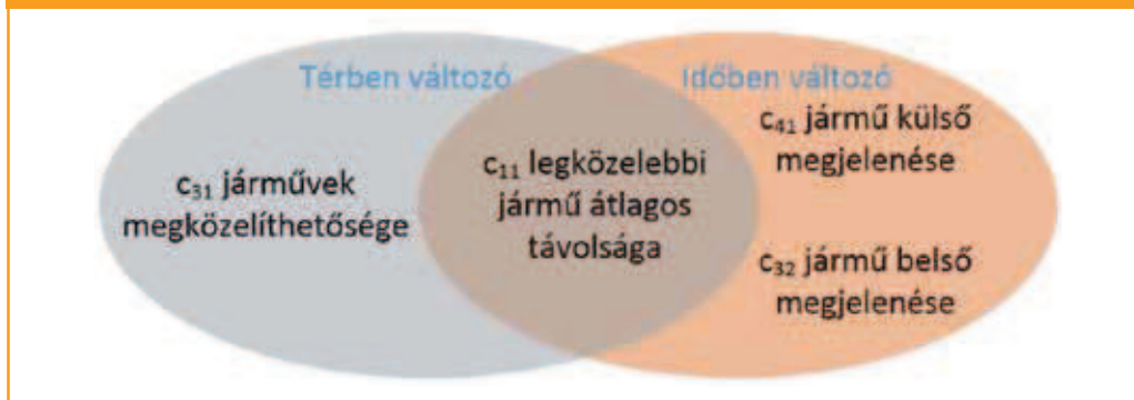
2. ábra: Térben és időben változó minőségi ismérvek

A minőségi ismérvek értékelő számainak meghatározásakor a felhasználók érdekeit vettük figyelembe. Például c_{11} megmutatja, hogy mennyit hajlandó gyalogni a járműhöz egy átlagos felhasználó, c_{42} megmutatja a gépkocsi külső méretét. Az ideális jármű jellemzője, hogy „kívül kicsi, belül nagy”. Az üzemidő ( c_{13} ) esetén az egyes időintervallumok súlyszámainak a kereslet egy napon belüli ingadozása alapján határoztuk meg. Az időszakok súlyszáma a járműhasználat valószínűségének nagyságával egyenesen arányos; x , y , z mutatja az adott időintervallumokba eső üzemórákat. A férőhely, csomagter ( c_{34} ) minőségi ismérv esetén eltérő értékelést határoztunk meg, aminek okai a szolgáltatás típusától függő helyváltoztatási motivációk. Round-trip típusú szolgáltatás esetén elsősorban szabadidős tevékenység a fő motiváció, amit nagy kapacitású járművekkel lehet jól kiszolgálni.