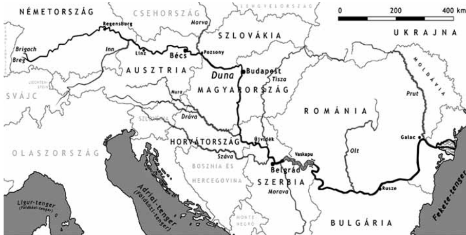
2. ábra. A Duna menti országok és fővárosai (Bécs, Pozsony, Budapest, Belgrád)

A Duna menti városoknak kiemelkedő hidrológiai adottságaik vannak. E környezeti erőforrás hőszivattyús hasznosítása a Duna melletti városok (a Duna menti országok és fővárosaik: Bécs, Pozsony, Budapest, Belgrád) levegőjét és környezetét élhetőbbé, egészségesebbé teheti (2. ábra).