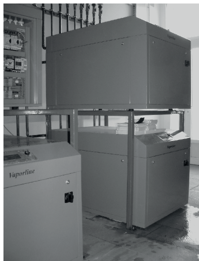
2. ábra. Magyar hőszivattyúk a nagy-kőrösi fürdő hőközpontjában