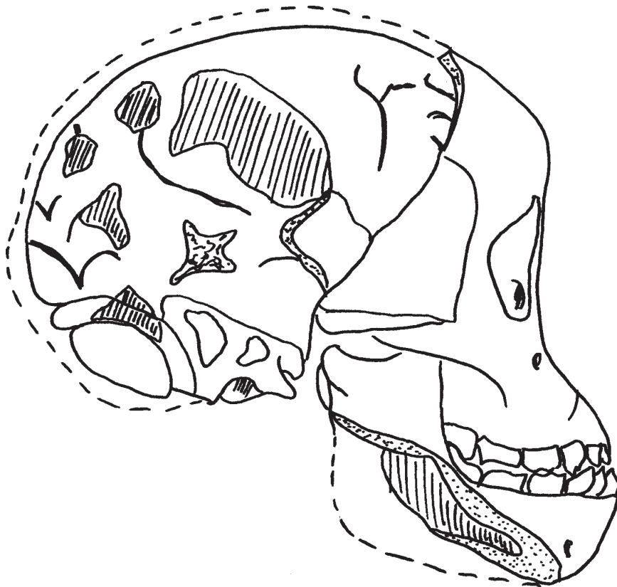
Rys. 2. Rekonstrukcja czaszki australopiteka dokonana przez R. Darta*.

* R. Dart, Australopithecus africanus: the man – ape of South Africa , art. cyt., 197.