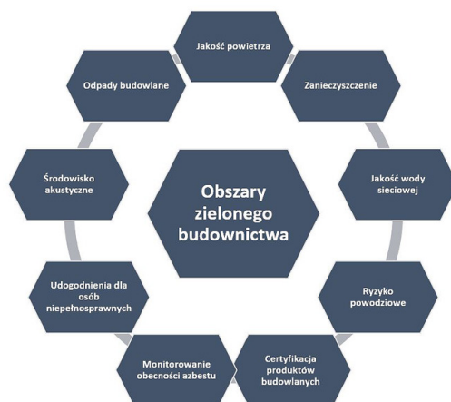
Ryc. 1. Obszary zielonego budownictwa

W praktycznym wdrażaniu zielonego budownictwa do przestrzeni miejskiej czy też wiejskiej ważne jest współdziałanie w wielu obszarach, które zapewnią docelowo zrównoważony rozwój danego obszaru. Przy projektowaniu zielonych budynków uwagę zwraca się zarówno na aspekty środowiskowe, jak i jakość powietrza, wody, czy też monitorowanie zanieczyszczeń, ale również aspekty społeczne, takie jak wprowadzenie udogodnień dla osób niepełnosprawnych.