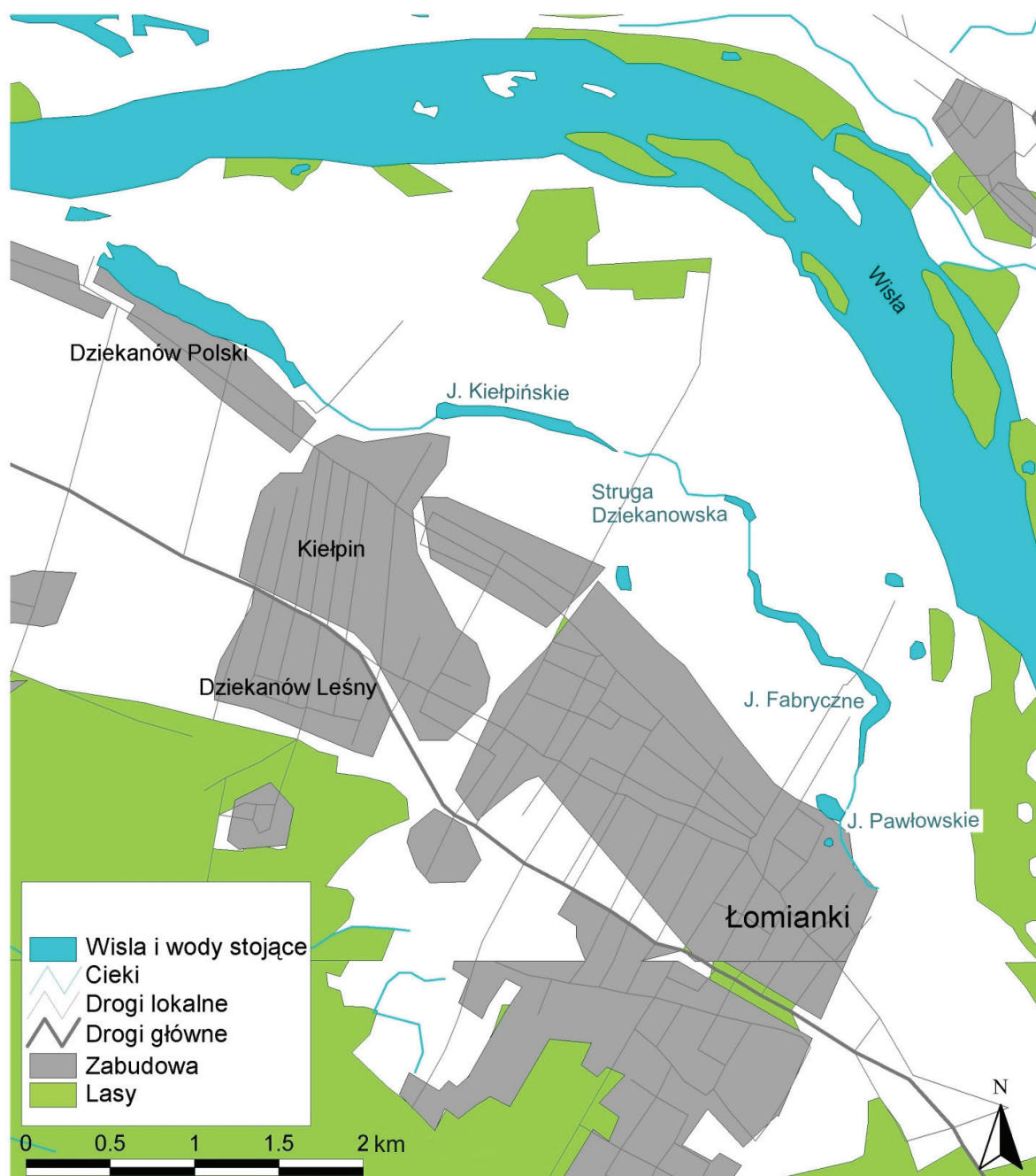
Rys. 1 Teren badań ze wskazaniem lokalizacji J. Kiełpińskiego i głównych jezior o charakterze storzeczy w ciągu Strugi Dziekanowskiej.

W celu waloryzacji szaty roślinnej poszukiwano chronionych i zagrożonych oraz rzadkich gatunków roślin rosnących w cieku wodnym i ciągu starorzeczy. Wstępnie rozpoznano ważniejsze zbiorowiska roślinne.