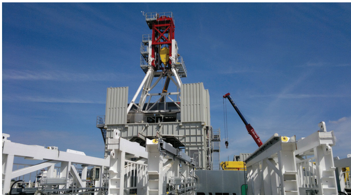
Rys. 1. Konstrukcja urządzenia wiertniczego

Oddziaływanie procesu wydobywczego gazu z łupków na środowisko było i jest przedmiotem licznych badań i analiz naukowych. Wynika z nich, że prawidłowo prowadzone wydobywanie gazu z łupków nie ma wpływu na jakość wody pitnej, zanieczyszczenie powietrza i gleby, czy procesy sejsmiczne. Naukowcy nie widzą też zagrożeń dla zdrowia ludzi i zwierząt (Konieczńska et al. 2011), a zastosowanie wszystkich wymaganych prawem procedur i środków ostrożności stanowi podstawę do zabezpieczenia środowiska naturalnego. Prawo europejskie gwarantuje ochronę środowiska przed skutkami przemysłu wydobywczego. Do najważniejszych instytucji, które sprawują kontrolę bezpieczeństwa środowiskowego przy poszukiwaniach i wydobywaniu gazu z łupków należą: Ministerstwo Środowiska, Generalna Dyrekcja Ochrony Środowiska, Krajowy Zarząd Gospodarki Wodnej, Główny Inspektorat Ochrony Środowiska, Wyższy Urząd Górniczy oraz władze samorządowe. Rozpoznawanie, poszukiwanie i wydobywanie gazu z łupków jest możliwe jedynie na podstawie koncesji wydawanej przez Ministerstwo Środowiska. Inwestor jest zobowiązany do uzyskania decyzji o środowiskowych uwarunkowaniach, która stanowi załącznik do