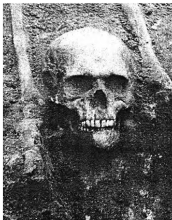
Fot. 1: Grób odnaleziony w Starym Brześciu Kujawskim 18

W Polsce wczesnopiastowskiej panował zwyczaj układania ciała zmarłego w pozycji wyprostowanej na wznak, z głową w kierunku zachodnim. Jednak groby ludzi uznanych powszechnie za upiory różniły się od pochówków zwykłych „śmiertelników”. Ciało ich było ułożone w nienaturalnej pozycji, zdarzało się, że ręce wiązano na plecach. Mogiły takie często zawierały niekompletne szkielety lub przemieszane kości. Prawdopodobnie był to rezultat ćwiartowania zmarłego. Podobnie, w celu uniemożliwienia wampirowi opuszczenia grobu kaleczono mu pięty lub przecinano ścięgna pod kolanami. Najpewniejszym sposobem było jednak obcięcie głowy i umieszczenie jej między nogami, tak aby wampir nie mógł jej uchwycić rękami. Sposób odcinania głowy jest źródłem wierzeń o upiorach niosących własną głowę w rękach. Taki rodzaj pochówku znany jest w Polsce jedynie ze stanowiska w Starym Brześciu Kujawskim. (por. fot. 1)