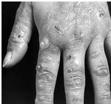
Fot. 2: Porfiria skórna

wystarczy by na twarzy i innych odkrytych częściach ciała powstały ropiejące pęcherze 29 . W odmianie przewlekłej następuje tzw. bliznowacenie, wypadanie włosów (lub rzadziej ich nadmierny wzrost) i pogrubienie skóry w miejscach narażonych na światło. (por. fot.2)