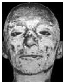
Fot. 3: Twarz chorego na porfirię

Szkodliwe substancje nagromadzone w tkankach odpowiedzialne są również za silnie czerwoną fluorescencję uzębienia chorych osób. Ponadto może dochodzić do obkurczanie dziąseł, przez co szyjki zębów ulegają odsłonięciu, i zęby w tym kły zdają się być dłuższe niż są. Chorobie towarzyszyć mogą także postępujące deformacje twarzy powstające w wyniku zmian zapalno-martwiczych prowadzących do pojawienia się zniekształcających blizn. Spotykane są również przypadki utraty nosa czy palców, powstania wyjątkowo szpecących blizn, ściągnięcia warg i dziąseł. Ponieważ produkty metabolizmu porfiryn wydalane są z moczem lub kałem, te przybierają czerwoną barwę 30 . (por. fot.3)