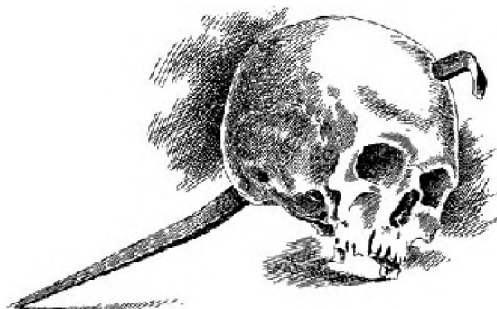
Ryc. 3: Czaszka przebita gwoździem odnaleziona w 1870 roku w okolicach Piotrkowa koło Radomia 22 .

Jedną z dróg eliminacji wampira było zerwanie nadnaturalnego połączenia mary z ciałem zmarłego. Należało jedno z nich zniszczyć, a ponieważ z marą nie można było skutecznie walczyć, zatem odgrzebywano ciała i je palono 23 . W jednej z czeskich kronik z XV wieku zanotowano dwa takie przypadki – w latach 1336 i 1344. Oto jeden z nich: „W Czechach (...) we wsi Blow umarł pasterz. Źen wstając co nocy chodził wokół po wszystkich wsiach, ludzi straszył, dusił i wywoływał. A gdy został kołkiem przebity, mówił szyszając: a to mi bardzo zaszkadzili, bo mi dali laskę, żebym się mógł psom opędzać! A gdy go odkopali, był wzdęty jak wół i ryczał strasznie. A gdy go rzucono w ogień, ktoś porwawszy kij wbił w niego, i natychmiast trysnęła krew jak z naczynia. Gdy został wykopany i włożony na wóz, ściągnął nogi ku sobie jak żywy, ale gdy go spalono, całe zło ustało” 24 .