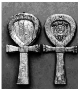
Fot. 4: Symbol Ankh. [Ashmolean Museum, Oxford]

Często symbolem używanym współcześnie przez członków sekt wampirycznych jest krzyż Ankh ( crux ansata ). Znak ten zaczerpnięty został z kultury starożytnego Egiptu, gdzie uznawano go za paginację fizycznego i nieśmiertelnego życia. Symbol ten dawał – poprzez emanowane energii – nieśmiertelność i wieczne zdrowie. W języku starożytnym Kemetu hieroglif ten oznaczał „życie”. Symbol ten został następnie przejęty przez Fenicjan i za ich sprawą stał się znany w świecie semickim. Krzyż Ankh nie jest związany z historią wampirów, został sztucznie zaabsorbowany przez członków sekt. Połączenie to jest dość niefortunne, z uwagi na fakt, iż Ankh powiązany był pierwotnie z kultem słonecznym, od którego przecież „prawdziwy” wampir stroni. (por. fot.4)