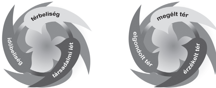
1. ábra: A „létezés trialektikája” és a „térbeliség trialektikája” The 'trialectics of being' and the 'trialectics of spatiality'