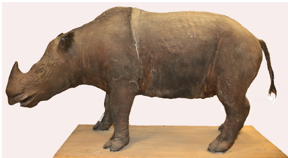
1. ábra. Az MTM montírozott Dicerorhinus sumatrensis sumatrensis példánya (HNHM 68.583.1.)