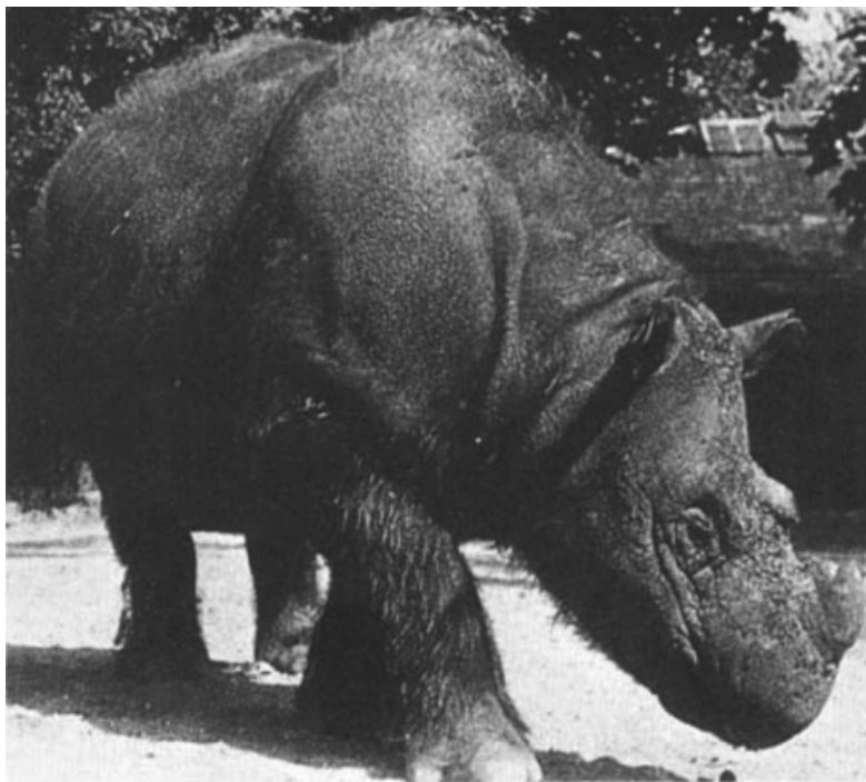
4. ábra. „Subur” szumátrai orrszarvú a koppenhágai állatkertben (GROVES & KURT 1972) Fig. 4. “Subur”, the Sumatran rhino of the Copenhagen Zoo (GROVES & KURT 1972)