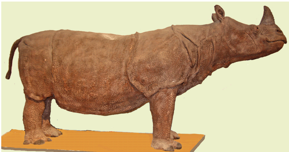
5. ábra. Az MTM montírozott Rhinoceros sondaicus sondaicus példánya (HNHM 1100.107) műanyag tülökkel

A HNHM 1100.107 példány méretei (a montírozott állaton utólag felvéve) a következők: marmagasság 130 cm, teljes testhossz 300 cm, farokhossz 50 cm.