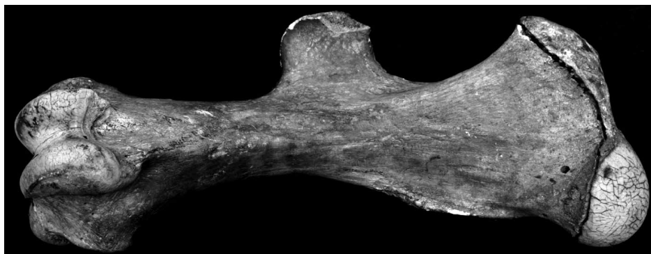
6. ábra. A feltehetően a HNHM 1100.107 számú Rhinoceros sondaicus sondaicus példányhoz tartozó megégett combcsont