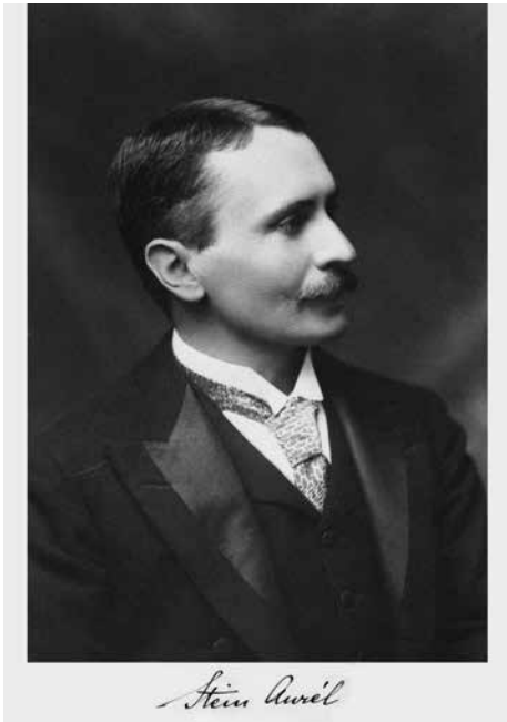
1. kép STEIN AURÉL (Budapest, 1862 – Kabul, 1943) (A kép a „Romvárosok Ázsia sivatagjaiban” 1913. évi kiadása alapján készült)

Photo 1 SIR AUREL STEIN (Budapest, 1862 – Kabul, 1943) (The picture is from the 1913 edition of Ruined cities in Asian deserts)