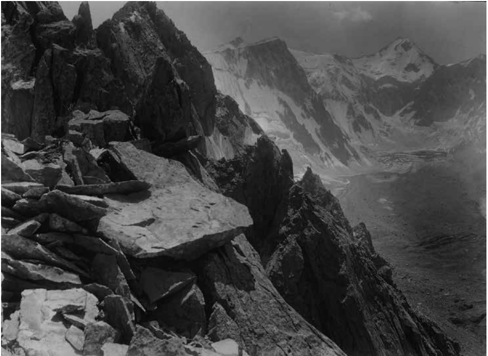
4. kép A Káskul-gleccser a Nissza-völgy felett. (Cat. Stein LHAS 37.4.2) Photo 4 Kashkul Glacier above Nissa Valley