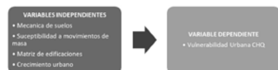
Figura 2. Variables dependientes e independientes Con esto clasificar las micro zonas del CHQ con vulnerabilidad medidas en 3 niveles: alto, medio y bajo.

Zonas de altos morfológicos como las lomas de Ilumbisí, Puenqasí,