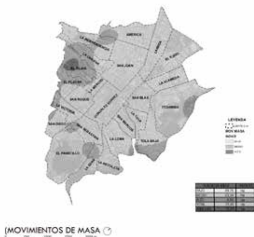
Figura 6. Mapa de movimientos de masas

Sena, El Panecillo, Itchimbia, La Alameda, San Blas, El Ejido, San Juan, San Diego