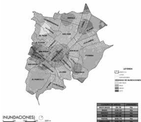
Figura 5. Mapa de inundaciones

Bajo: La Recoleta, La Independencia, El Tejar, El Placer, San Marcos, La Loma, La