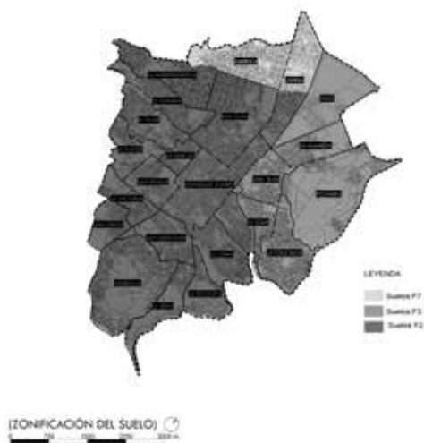
Figura 3. Zonificación del CHQ

Asentamientos: El CHQ cuenta con diversas condicionantes geográficas, volcánicas, topográficas e hidrográficas que determinan el suelo de la zona, esta serie de accidentes crea una red de 9865.07 m 2 de área, que han sido urbanizados de forma informal, el análisis de asentamientos presentados en la matriz