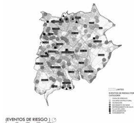
Figura 7. Mapa de movimientos de masas