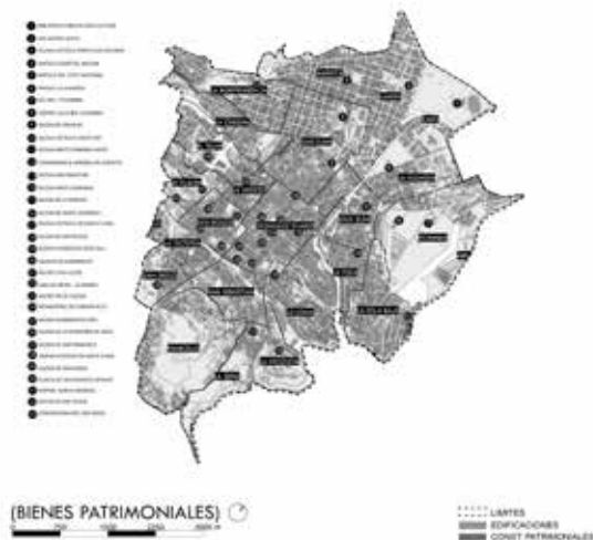
Figura 9. Mapa de Zonas Patrimoniales del CHQ.

Origen de asentamientos informales: La primera, corresponde a las tierras agrícolas integradas a la ciudad, estas áreas en un principio fueron consideradas asentamientos periféricos por su ubicación en las áreas inmediatas