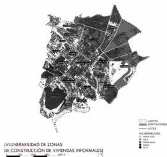
Figura 8. Vulnerabilidad de zonas de construcción de viviendas informales

Deterioro de la vivienda y estado de conservación: El despoblamiento contribuye al deterioro de los inmuebles, debido al abandono o subutilización de estos. El Plan Especial del Centro Histórico de Quito de 2003 identificó que el 75,93%