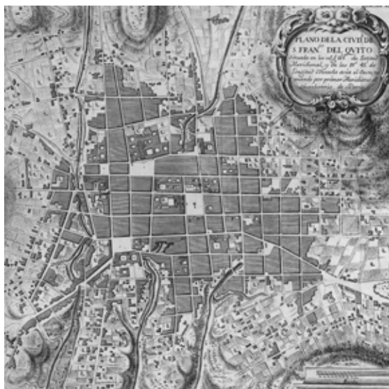
Figura 1. Ciudad de Quito, 1748

El inicial delineamiento del área del Centro Histórico como lugar esencial de las identidades local y nacional se