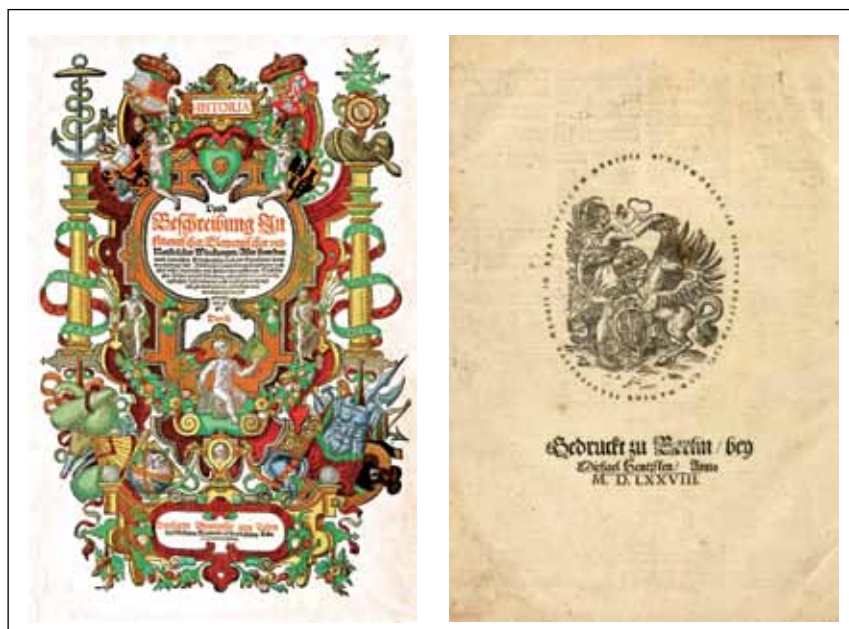
1. ábra. Laonhardt Thurneysser zum Thurm Historia című könyvének első oldala és utolsó lapja, a szerző és kiadó Thurneysser címerével

lemző stílusú, fametszett címerét is tartalmazó kiadói jelzet. (Thurneysser 1569-től saját kiadói vállalkozást és nyomdát működtetett.) 7