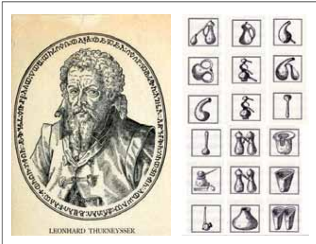
8. ábra. Thurneysser képmása a Historia című kötetből és az alkímista ábécé néhány betűjének képe

nyomatott ki. Ő alkotta meg – itt, Brandenburgban – az első tudományos kísérleti bemutató termet, valamint egy növényházat, ahol egzotikus állatok is éltek.