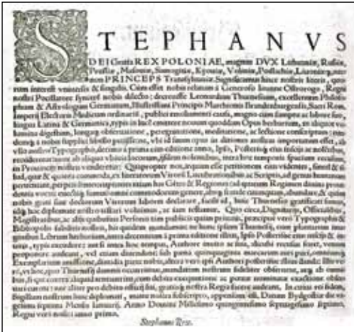
3. ábra. Leonhardt Thurneysser zum Thurn most megkerült Historia und beschreibung influentischer elementischer und natürlicher wirkungen című könyvét Báthory István erdélyi fejedelemnek ajánlotta

gyel királynak és erdélyi fejedelemnek, Báthory Istvánnak (1533–1586) mond köszönetet ( 3. ábra ). Thurneysser korának egyik leghíresebb fametsző illusztrátorával, Jost Ammannal (1539–1591) dolgozott együtt. (A Thurneysseről készült számos ovális portrét a frankfurti Peter Hille készítette. Az arcképeket díszítő attribútumok között és a könyv egyes ábráin is gyakran megjelenik Thurneysser címere. Magáról Thurneysserről is sok fametszet található, hiszen meglehetősen öntörvényű és hiú ember lehetett. Egyéni ötlete volt az alkímiai ábécé megszerkesztése, melyben az egyes betűket hajlított csőrű reorták adták ki ( 4. ábra ). Hofmeier 8 szerint a betűk eredetileg egy Milius nevű alkímistától származnak, akiről nem sokat tudunk.