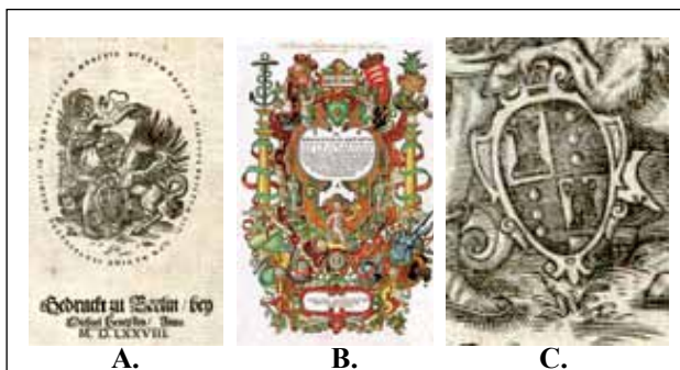
7. ábra. Thurneysser könyvének hátlapján attributumként megjelenik Pegazus, ami egyik lábával Thurneysser címerét tartja, másikkal pedig az asztrológiai tudományát jelképező éggömböt (A.). A címerpajzs megjelenik a könyv első oldalán is (B.). A címerpajzs két bástya motívuma szülővárosára Bázeltre utal, a három korong (gyűrű) pedig az alkémia egyik régi szimbóluma, ami ifjúkori mesterének, Johannes Huber bázeli orvosprofesszor címerében mint fő elem jelenik meg (6. ábra) (C.). Thurneysser könyveiben gyakori motívum a fiatalkori katonaeveire utaló vértzet, az utazásaira emlékeztető horgony és csónak, valamint számos alkímiai eszköz

Johannes Huber (6. ábra) famulusa lett. Segített a gyógynövények gyűjtésében, azok preparálásában, a gyógyszerkészítésben, majd fizikai és kémiai kísérletekben. Kifejlődött érdeklődése az ásványtan és