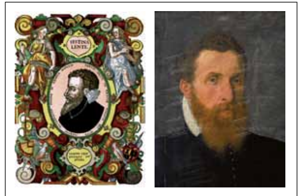
5. ábra. Leonhardt Thurneysser képmása a Historia negyedik oldalán és egy ismeretlen művész által készített festményen. (A szerző jelmondata: festa lente, vagyis lassan járj, tovább érsz.)

zósága, színe, szaga, íze és ezek változása fontos volt a diagnosztizálásban. A XVI. század orvosa például külön segédet alkalmazott a vizelet ízének (cukor és aceton) vizsgálatára, az akkor még megnevezhetetlen diabetes megállapításában. Az uroszkópiái vizsgálathoz, a fényviszonyok megfelelő kialakítására jellemzőes gömblombikot használtak, melyből számos megtalálható az orvostörténeti múzeumokban ( 5. ábra ). A vékony nyakkal ellátott lombiknak teljesen átlátszónak, szabályos gömb formájúnak és homogén falvastagságúnak kellett lennie az optimális fényviszonyok biztosítása érdekében. A frissen kapott vizeletet hőszigetelő köpennyel ( 5A. ábra ) igyekeztek testhőmérsékleten tartani és állandó keverés közben figyelték a kiváló szil-