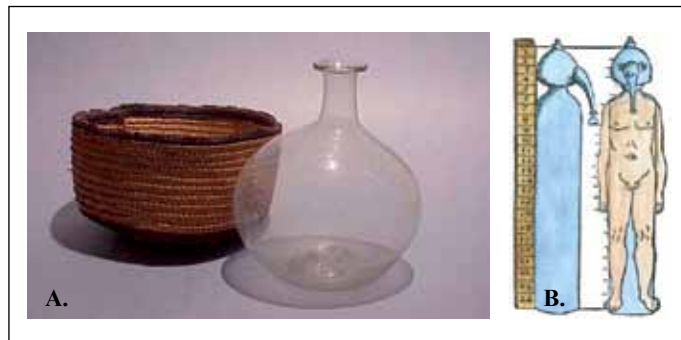
4. ábra. Vizeletvizsgálatra szolgáló gömblombik hőszigetelő kosárral (A.) és a Thurneysser által használt, ember formájú bepárló edény (B.)

A gömblombik helyett egy emberi testet mintázó üveg edényt alakított ki ( 5B. ábra ). Thurneysser a beküldött vizelettel megtöltötte a diagnosztikus edényét, majd a nyitott orrészén keresztül a vizet kidesztillálta. A vize-