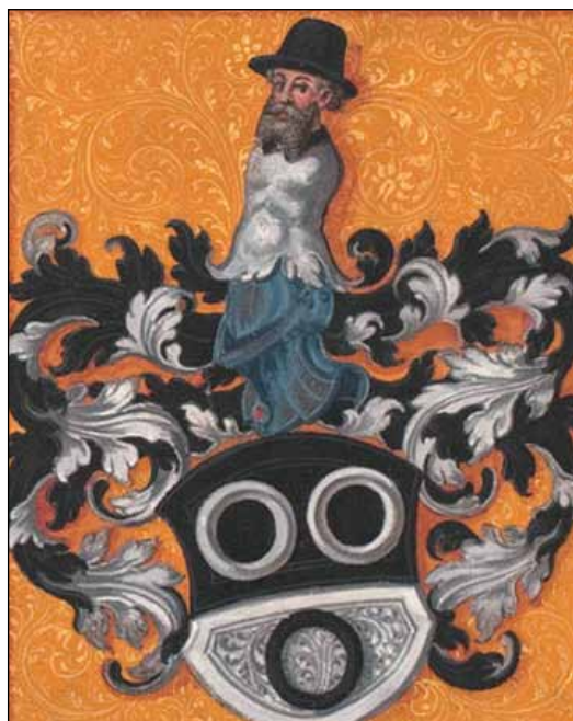
6. ábra. Johannes Huber (1507–1571) bázeli orvosprofesszor (az egyetem rektora), Thurneysser első tanárának címere

Laonhardt a győzedelmes bázeli reformáció (1527–1529) idején, 1531-ben született, Bázelenben. Tanulmányairól keveset tudunk, de bizonyos, hogy egyetemi tanulmányokat nem folytatott, pedig az atyai házban elsajátított aranyműves mesterség után a híres bázeli orvosprofesszor