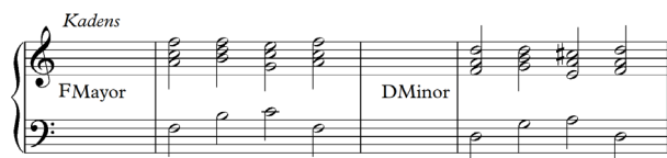
Notasi 15: Susunan kadens dari tangga nada F mayor dan D minor.

Materi selanjutnya adalah kadens dari tangga nada F mayor dan D minor yang dimainkan dengan progres akor I-IV-V-I. Akor I-IV-V-I dari tangga nada F mayor adalah F-B-C-F dan akor I-IV-V-I dari tangga nada D minor adalah Dm-Gm-A-Dm. Berikut contoh susunan notasi kadens yang benar pada F mayor dan D minor.