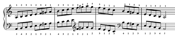
Notasi 2: Susunan dan penjarian tangga nada A minor.

Materi selanjutnya yaitu trinada dari tangga nada C mayor dan A minor yang dimainkan dalam 3 oktaf naik turun secara arpeggio dengan penjarian yang benar. Berikut contoh susunan notasi dan penjarian yang benar dari trinada C mayor dan A minor.