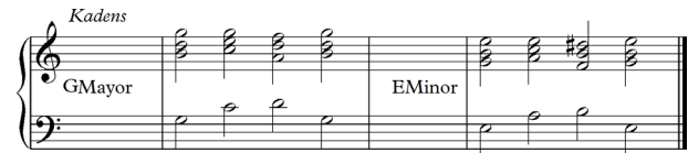
Notasi 10: Susunan kadens dari tangga nada G mayor dan E minor.

Materi selanjutnya yaitu kadens dari tangga nada G mayor dan E minor yang dimainkan dengan progres akor I-IV-V-I. Akor I-IV-V-I dari tangga nada G mayor adalah G-C-D-G dan akor I-IV-V-I dari tangga nada E minor adalah Em-Am-B-Em. Berikut contoh susunan notasi kadens atau progres akor dari tangga nada G mayor dan E minor yang harus dimainkan oleh mahasiswa.