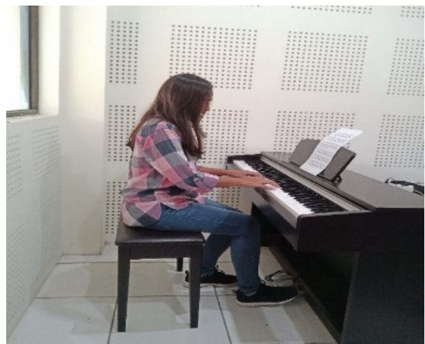
Gambar 3: Foto Proses pembelajaran Instrumen Wajib Piano I secara individu.