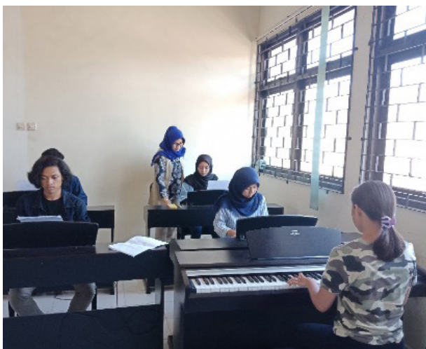
Gambar 2: Foto Proses pembelajaran Instrumen Wajib Piano I secara kelompok.

Pada pertemuan keempat ini, mengulang materi pertemuan sebelumnya, mahasiswa diminta untuk mempraktikkan bermain piano pada materi tangga nada, trinada, dan kadens dari tangga nada G mayor dan E minor. Materi tersebut harus dimainkan secara lancar dan penjarian yang benar. Proses pembelajaran Instrumen Wajib Piano I pada materi tersebut, dalam praktik