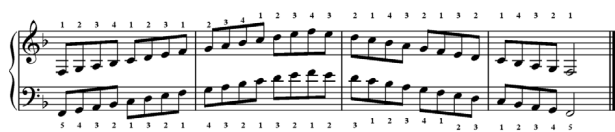
Notasi 11: Susunan dan penjarian tangga nada F mayor.

Selanjutnya setelah semua mahasiswa melakukan praktik bermain piano secara individu dengan lancar, kemudian diberikan materi baru. Materi baru ini untuk dipersiapkan sebagai bahan pertemuan berikutnya. Materi tersebut yaitu tangga nada, trinada, dan kadens dari tangga nada F mayor dan D minor. Tangga nada F mayor dan D minor yang dimainkan dalam 3 oktaf searah naik turun dengan penjarian yang benar. Berikut contoh susunan notasi dan penjarian yang benar pada tangga nada F mayor dan D minor yang harus dimainkan oleh mahasiswa.