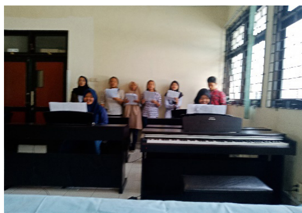
Gambar 4: Foto Penerapan sight singing pada materi etude dari Beyer , Op. 101, No. 58.

Pembelajaran mata kuliah Instrumen Wajib Piano I, yang banyak mengalami hambatan dalam membaca notasi musik, terutama pada materi etude , sonatine dan buah musik atau lagu. Hal ini karena dalam memainkan piano harus terbagi antara membaca notasi dan penjarian yang benar. Oleh karena itu, untuk mengatasi hal tersebut, diperlukan suatu strategi untuk meningkatkan pembelajaran mata kuliah Instrumen Wajib Piano I. Strategi yang dilakukan dalam proses pembelajaran