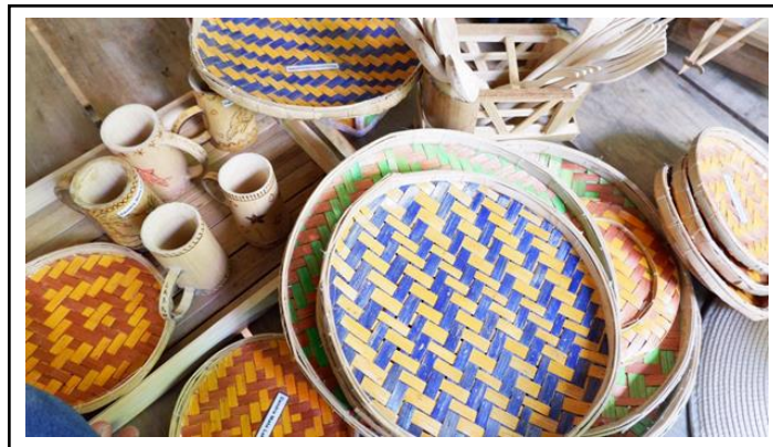
Gambar 1. Hasil desain kerajinan bambu sebelum pelatihan.

ada pesanan yang banyak, kerajinan yang telah selesai akan dikumpul di rumah ketua kelompok. Hasil kerajinan bambu sebelum pelatihan dapat dilihat pada Gambar 1 di bawah ini. Sedangkan Gambar 2 menunjukkan hasil desain kerajinan bambu setelah pelatihan dan workshop. Selain itu perbandingan hasil kerajinan sebelum dan sesudah pelatihan dapat dilihat pada Tabel 1.