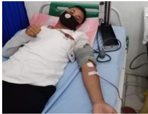
Gambar 3. Kegiatan donor darah di RSUD Bangka Tengah

Kegiatan edukasi selanjutnya yang dilaksanakan pada program pengabdian kepada masyarakat di Desa Penyak adalah mempromosikan dan melaksanakan donor darah. Program ini dilaksanakan mengingat berkurangnya persediaan darah di berbagai fasilitas penyedia darah selama pandemi COVID-19. Banyak masyarakat yang enggan melakukan donor darah dikarenakan khawatir dengan penyebaran COVID-19. Namun disisi lain, kebutuhan penerima donor darah tetap menjadi permasalahan di berbagai rumah sakit. Oleh karena itu, kegiatan ini diharapkan dapat menjawab kekhawatiran masyarakat terkait amannya proses donor darah selama tetap menerapkan protokol kesehatan seperti ditunjukkan pada Gambar 3. Kegiatan donor darah dilakukan melalui kerja sama antara tim pengabdian kepada masyarakat dengan RSUD Bangka Tengah.