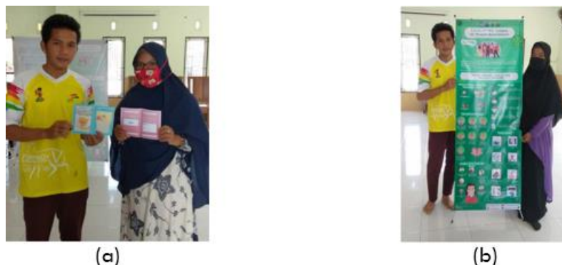
Gambar 5. Penyerahan: (a) buku saku edukasi dan (b) x-banner edukasi terkait adaptasi kebiasaan baru di Desa Penyak

Selain kegiatan sosialisasi bagi masyarakat, tim pengabdian kepada masyarakat juga memberikan media edukasi yang diletakkan di Kantor Desa Penyak. Media edukasi yang diberikan berupa buku saku dan x-banner terkait dengan perilaku hidup sehat dan bersih serta protokol kesehatan seperti ditunjukkan oleh Gambar 5. Diharapkan dengan adanya media edukasi tersebut, dapat menjadi pengingat bagi masyarakat untuk mencegah penyebaran COVID-19 di Desa Penyak.