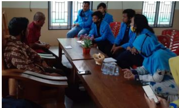
Gambar 1. Kegiatan koordinasi bersama dengan Kepala Desa Penyak terkait pelaksanaan program pengabdian kepada masyarakat

Kepala Desa Penyak beserta dengan tim pelaksana pengabdian kepada masyarakat dan para mahasiswa Universitas Bangka Belitung. Melalui koordinasi ini diperoleh berbagai informasi mendalam terkait dengan target peserta kegiatan dan fasilitas umum sebagai titik lokasi penyemprotan desinfektan serta pemasangan peralatan cuci tangan. Adapun fasilitas umum yang dimaksud tersebut diantaranya adalah lingkungan kantor Desa Penyak, sekolah (PAUD Desa Penyak), posyandu, dan tempat ibadah [14]. Sedangkan target peserta kegiatan edukasi sebanyak 50 warga Desa Penyak yang berasal dari berbagai kalangan.