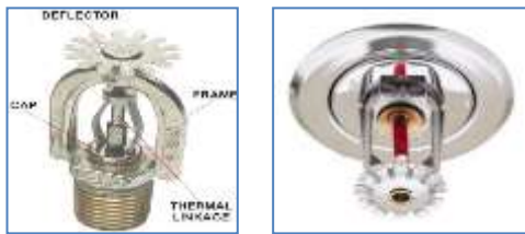
Gambar 4. Bentuk Sprinkler Otomatis