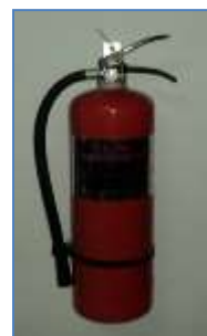
Gambar 3. APAR di Gedung Rektorat Undana.