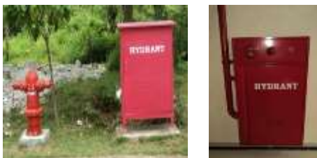
Gambar 5. Hidran Kebakaran di Gedung Rektorat Undana

Berdasarkan hasil observasi di lapangan dan wawancara dengan Teknisi pada Sub Bagian Rumah Tangga pada Gedung Rektorat Undana, diperoleh data dan informasi bahwa Hidran Kebakaran yang terpasang di Gedung Rektorat Undana terdiri dari Hidran Gedung dan Hidran Halaman. Jumlah Hidran Kebakaran yang tersedia seperti pada Tabel 5.