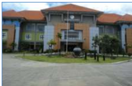
Gambar 4.12 Tempat Berkumpul di Depan Gedung Rektorat Undana.

di Gedung Rektorat Undana, di halaman depan gedung terdapat area yang cukup luas sebagai tempat berkumpul para pekerja atau penghuni gedung jika terjadi peristiwa kebakaran.