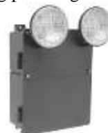
Gambar 11. Bentuk Penerangan Darurat di Dalam Gedung

Berdasarkan hasil observasi di lapangan dan wawancara dengan Teknisi pada Sub Bagian Rumah Tangga pada Gedung Rektorat Undana, diperoleh data dan informasi bahwa di Gedung Rektorat Undana belum ada atau belum dipasang penerangan darurat.