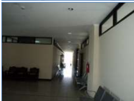
Gambar 8. Sarana Jalan Keluar di Gedung Rektorat Undana