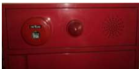
Gambar 1. Alarm Kebakaran di Gedung Rektorat Undana.