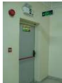
Gambar 10. Bentuk Pintu Darurat di Dalam Gedung

Berdasarkan hasil observasi di lapangan dan wawancara dengan Teknisi pada Sub Bagian Rumah Tangga pada Gedung Rektorat Undana, diperoleh data dan informasi bahwa di Gedung Rektorat Undana belum ada atau tidak ada pintu darurat.