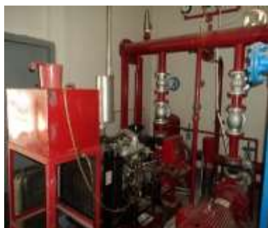
Gambar 7. Pompa Pemadam Kebakaran di Gedung Rektorat Undana

jokey, pompa utama, dan pompa cadangan. Pompa-pompa tersebut memiliki fungsi yang berbeda dan sumber penggerak utamanya menggunakan listrik PLN dan dan penggerak cadangannya menggunakan sebuah mesin disel.