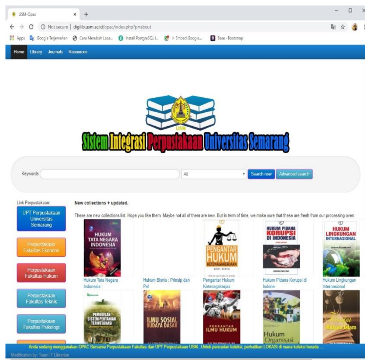
Gambar 1. Tampilan OPAC Universitas Semarang

Pada umumnya OPAC merupakan sebuah sistem informasi temu balik berbasis komputer yang diperuntukan untuk para pemustaka sehingga mudah dalam proses pencarian koleksi bahan pustaka.