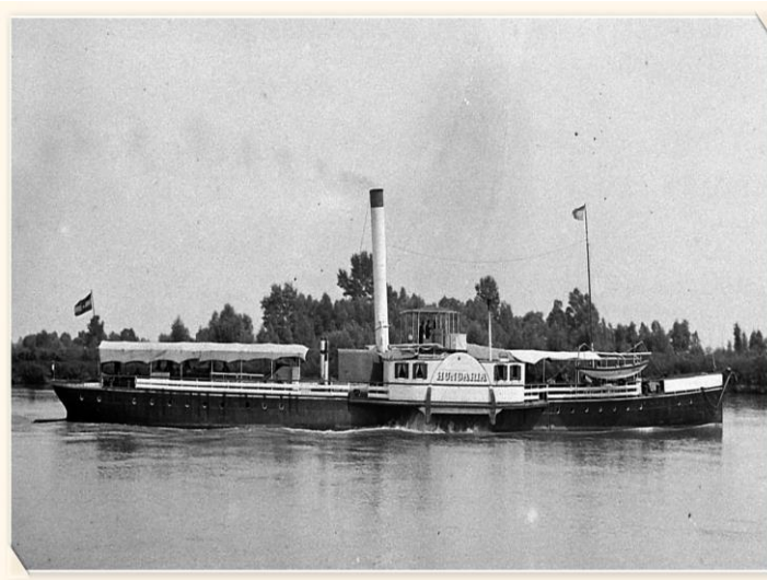
1. kép: Az egykori Luczenbacher-flottához tartozó Hungaria gőzös 1900-ban.

személyszállításba. Az 1860-as évek végétől a Luczenbacher-féle hajózási társaság 15 gőzhajót és 26 uszályt közlekedtetett a Dunán, emellett Pest és Mohács között személyhajó járatot is üzemeltetett (Jankó 1968). A család hajózási vállalata 1871-ben már a legnagyobb hazai vízfutató cégek egyike volt (1. kép).