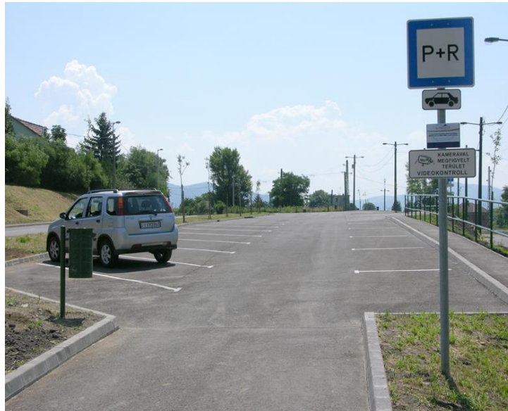
3. kép: A vasútállomás mellett 2010-ben átadott P + R parkoló

A 2000-es évek eleje óta Szob közlekedési centrum pozíciójában és közúti közösségi közlekedésében lényeges változás nem következett be. A várost a kistérség legtöbb településével napi 9–17 autóbusszjárat köti össze, ellenben Vác és a főváros irányába csak ritkán indulnak járatok és a menetidejük sem kedvező, mivel az átlagos utazási sebesség alacsony. Kismértékben javult viszont az autóbusszos utazás komfortfokozata, részben a megállóhelyek fejlesztésének köszönhetően. A Szobot érintő menetrendszerű autóbussz-forgalom utas-száma az utóbbi években a stagnálás jeleit mutatta, ami a térség gazdasági fejlődésével esetleg csekély növekedésbe mehet át.