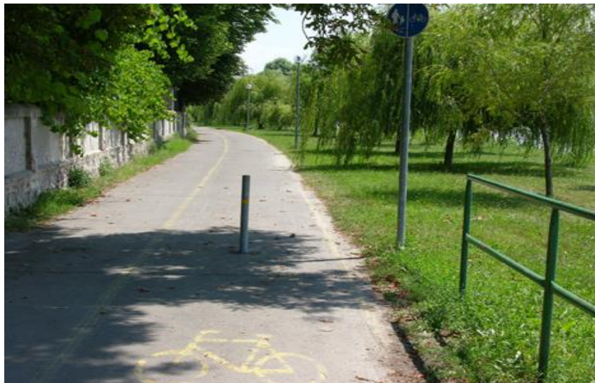
2. kép: A gyér forgalmú Duna parti kerékpárút Szobon

A turisztikai igényei magasabb szintű kielégítését segítette a személygépkocsi- és autóbusz-parkolóhelyek kialakítása, melynek eredményeként a város több pontján (vasútállomás szomszédságában, városháza előtt) is létesültek korszerű parkolók (3. kép).