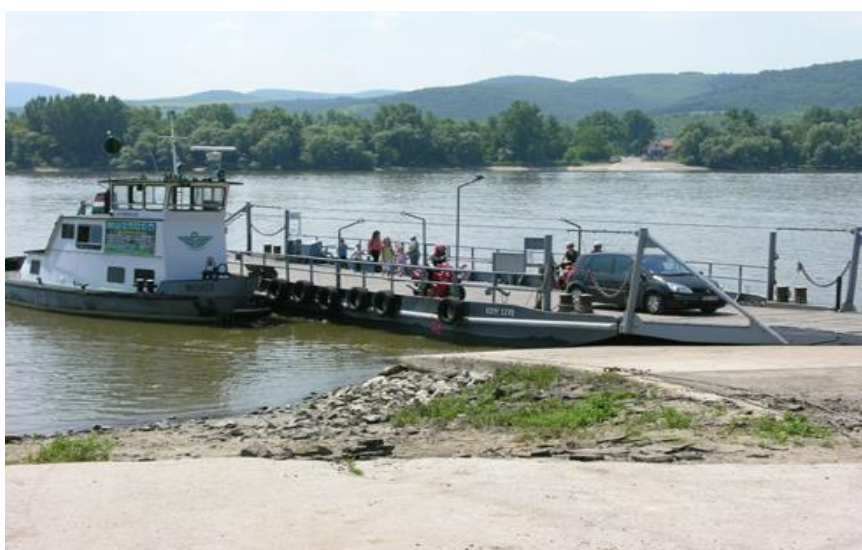
5. kép: Szob dunai kompkikötője napjainkban

A személy- és járműforgalmat egyaránt lebonyolító szobi kompot a helyi bejegyzésű Ferryboat Kft. üzemeltetette. Az 50 tonnás hordképességű komp egyidejűleg 200 utast és 24 db személyautót képes szállítani Szob és Pilismarót között. A kompkikötőhöz kapcsolódó infrastruktúra még mindig igen szegényes, habár a kikötő környéke rendezettebb lett (5. kép).