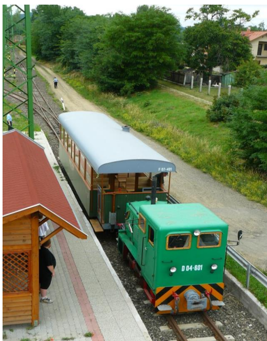
4. kép. A Szob és Márianosztra között közlekedő Börzsöny Kisvasút szobi végállomása

A kisváros vízi közlekedését változatlanul a Szob és Pilismarót között óránként közlekedő dunai komp forgalma képviseli, mivel a tavasztól őszi tartó dunai idegenforgalmi szezonban a Budapestről a Dunakanyaron át Esztergomba közlekedő menetrendszerű kiránduló- és szárnyashajók Szobot nem érintik. Okolható ezért az is, hogy folyami hajókikötője sincs.