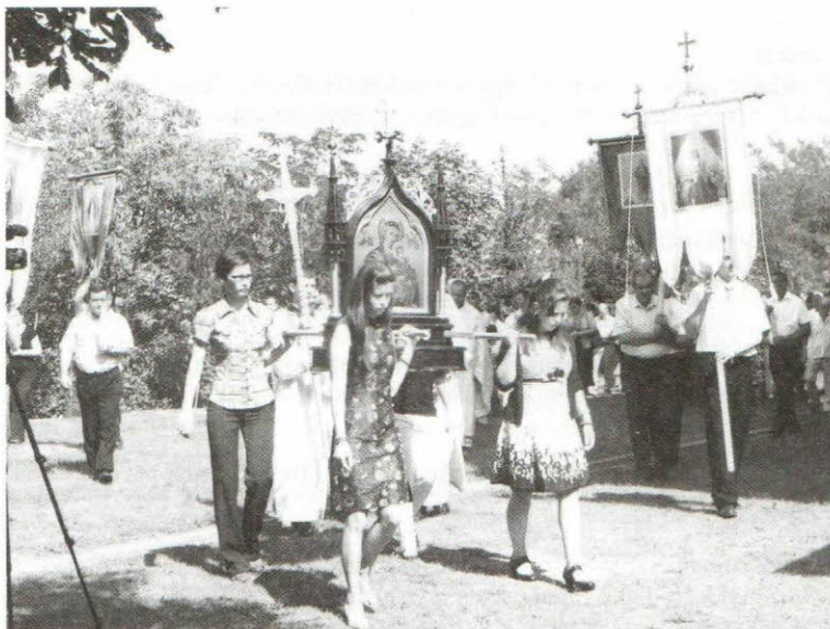
Ruszin búcsúi körmenet, Sajópálfala, 2013

A ruszin identitás formálásában a görögkatolikus egyház évszázadokon keresztül meghatározó szerepet töltött be. Napjainkban a vallási és nemzeti identitás újrakonstruálásának lehetünk tanúi. Hazánkban a magyar nemzeti identitás újraértelmezése mellett a nemzetiségek kulturális önazonosságának kifejezésében egyaránt fontos helyet töltenek be a civil és az egyházi intézményháló keretei. A nemzetiségi önkormányzatok és az egyházak látható vagy látens együttműködése a lokális és a globális kultúra formálásában egyaránt megmutatkozik. A közös kulturális tér kialakításának jó példája a néhány évvel ezelőtt újtárra indított rendezvény, a „ruszin búcsú”, mely az ősi görögkatolikus hit és a nemzeti összetartozás jegyében évről-évre lehetőséget biztosít a közösségalkotás kinyilvánítására. 39 Az országos rendezvényeken túl, a lokális közösségek identitásformálásában is tetten érhető a vallásos szemlélet megjelenése. Számos rendezvény fémjelzi ezt a közös munkát, melynek részét képezi a vallásos elemek megjelenése. A görögkatolikus egyház legfőbb szerepe a vallási hitélet szervezése, irányítása, mely a nyelv, az 'ethnos' és a 'mythos' 40 kapcsán a nemzeti értékek megőrzését, a történelmi identitás újateremtését segíti.