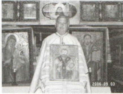
Ruszin búcsú a szentendrei Skanzen mándoki fatemplomában