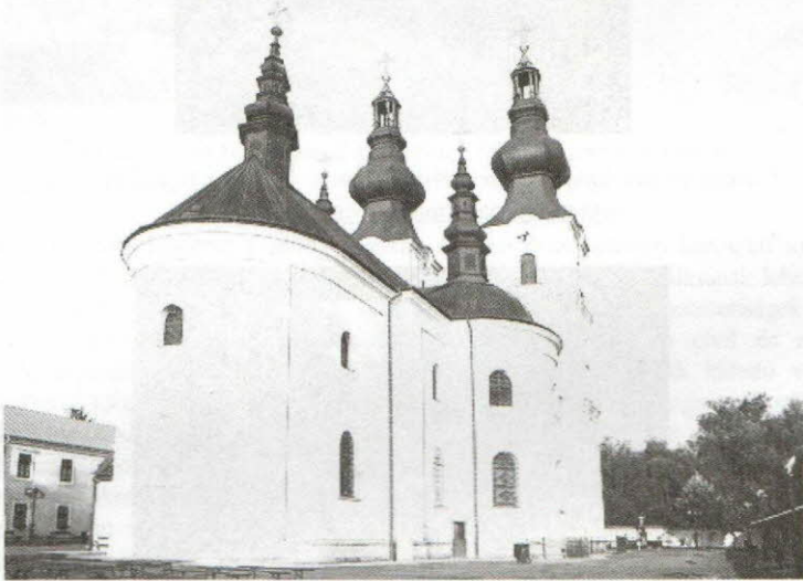
A máriapócsi görögkatolikus kegytemplom