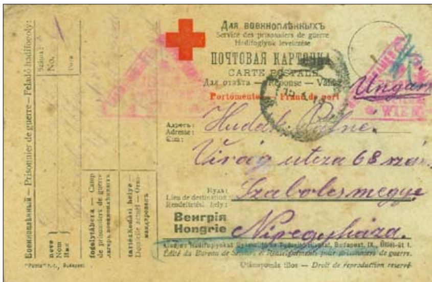
Levelezőlap az orosz fogságból

Vö. Engel: Genealógia, Becsegergely nem 3. tábla: Betleni (Bethlen), csak az Engel Pálnál nem szereplő adatokat jegyeztem! 1400: ZsO II. 530. sz.; 1435: DL 36554.; 1437: Kolmon. I. 212/87. sz.; 1440: Kolmon. I. 249/236. sz.; 1443: DL 62825.; 1448: DL 62841.; 1467: DL 27916. — A családfán félkövér betűvel állnak azon személyeknek a nevei, akik az 1498. évi nyugtában szerepelnek.