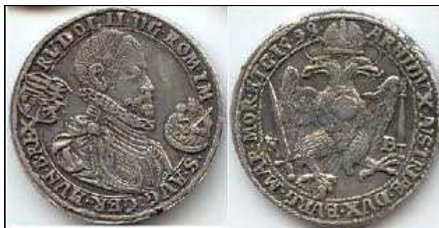
3. kép A nagybányai pénzverdéből származó pénzveret (1599) I. Rudolf magyar király képével