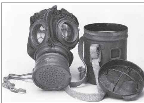
5. ábra. Osztrák–magyar 1917M gázálarc és doboza