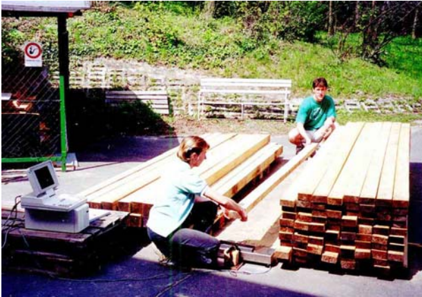
1.ábra– Osztályozó berendezés működés közben

faanyag osztályozására vonatkozó MSZ EN 338:1998 szabvány éppen a rugalmassági moduluszt és a sűrűséget veszi alapul. A szabvány arra a tapasztalatra épül, hogy a faanyag szilárdsága és rugalmassági modulusa között szoros kapcsolat van. A szabvány alkalmazása lehetővé teszi a faanyag biztonságos felhasználását és ezzel egy időben a fában rejlő szilárdsági tartalék kihasználását. A gépi szilárdsági osztályozásra felhasznált berendezésekkel szemben támasztott követelményekkel az MSZ EN 519:1998 szabvány foglalkozik. A berendezéshez tartozik egy mérleg, amely a vizsgált anyag tömegének a felét méri a kéttámaszú tartó elvén, vagyis a fűrészáru egyik vége a mérlegen a másik pedig egy szivacsos alátámasztáson fekszik fel, és a hozzákötött számítógép a mért értéket megszorozza kettővel. A mérleg alkalmas megválasztásával tetszőleges méretű faanyag minősítésére alkalmas a berendezés, pl.: rétegelt-ragasztott tartók, vezetékoszlopok, gerendák, stb.