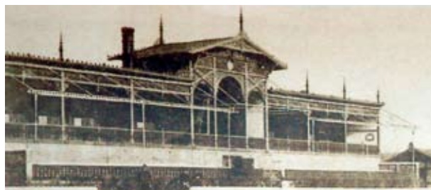
1. kép Favázas tribünépítmény a Lóversenytérén, 1894

A technika fejlődésével a faoromzat díszítőmunkáinak elkészítéséhez, illetve az áttört fűrészelt dekorációk kialakításához már új eszközök, gépek álltak rendelkezésre, melyek a legkülönbözőbb minták nagy szériában való gyártását tették lehetővé. A díszítőmunkák elemeinek kiválasztására a széles körben, nemzetközileg is elterjedt katalógusokat (2.kép) használták, melynek mintarajzait tetszés szerint kombinálva valósították meg. A motívumok éppúgy lehettek absztrakt geometrikus, vagy építészeti hagyományokat felelevenítő formák, mint növényi ornamentikák illetve állatfigurák. Több engedélyezési terv is megmaradt ezekről a