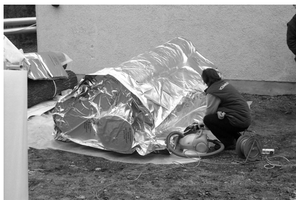
2. ábra – a levegő kiszivattyúzásával készült rakat

A második üzemi kísérletsorozatban tárolt rönkökből készült minták kémiai összetételét is vizsgáltuk. E vizsgálatok részletes leírását és eredményeit cikksorozatunk második része tartalmazza.