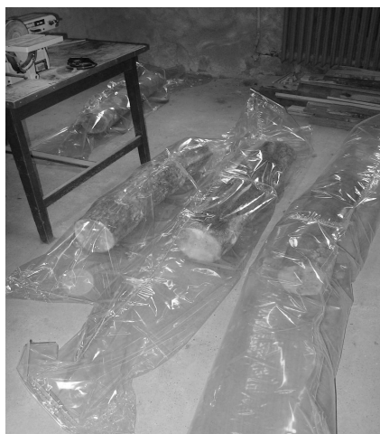
1. ábra – egyesével csomagolt rönkök (laboratóriumi kísérlet)

A becsomagolt rönköket és a fólia állapotát a hathónapos tárolási periódus során hetente szemrevételezéssel ellenőriztük. Lezárás után 1 és 5 hónappal, valamint közvetlenül felnyitás előtt a csomagokból egy 1000 ml-es injekciós tűvel levegőmintát vettünk, melyet légmentesen záró Tedlar mintaszállító zacskókba fecskendeztünk. A levegőminták elemzésére a Nyugat-Magyarországi Egyetem Kémiai Intézetének Shimadzu GC-14B gázkromatográf készülékén került sor. Hat hónapos tárolás után a rönköket kicsomagoltuk és az eredményeket szemrevételezéssel, valamint a rönkök asztalos szalagfűrészgépen történő felvágásával, és az elkészült fűrészáru értékelésével ellenőriztük. Ekkor került sor a nedvességtartalom meghatározására is. Az első üzemi kísérletek ugyanezen két fafaj tárolására irányultak. Ennek során Agrofol UVC Stabil 150 típusú fekete, ún. silófóliát