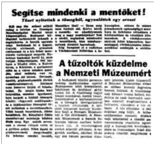
Népszava, 1956. október 26.