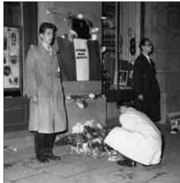
Varsó, 1956. október 29. Díszőrség a Magyar Intézet előtt, a zászlón a felirat: „Tisztelettel fejet hajtunk a magyar nép előtt”

gyógyszert és kötszert küldött Budapestre. Varsóból és Prágából három-három repülőgép szállított vért Budapestre.