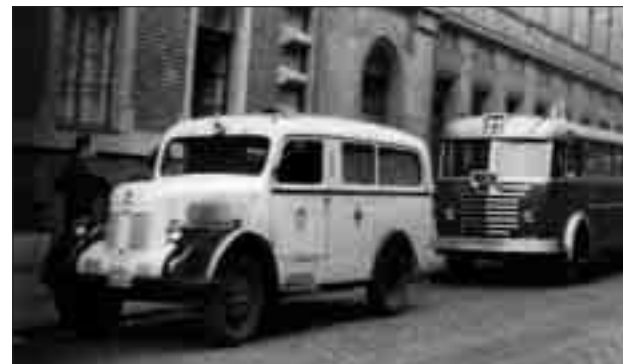
IFA rohamkocsi és autóbusz kivonulásra készen

reszt kerületi bizottságaival együtt végezték. A külföldről érkező segélyszállítmányokat a Közéllátási Kormánybizottság fogadta. Az osztrák határra érkező segélyszállítmányok továbbszállítására a Győr megyei forradalmi tanács elnökét kérték fel.