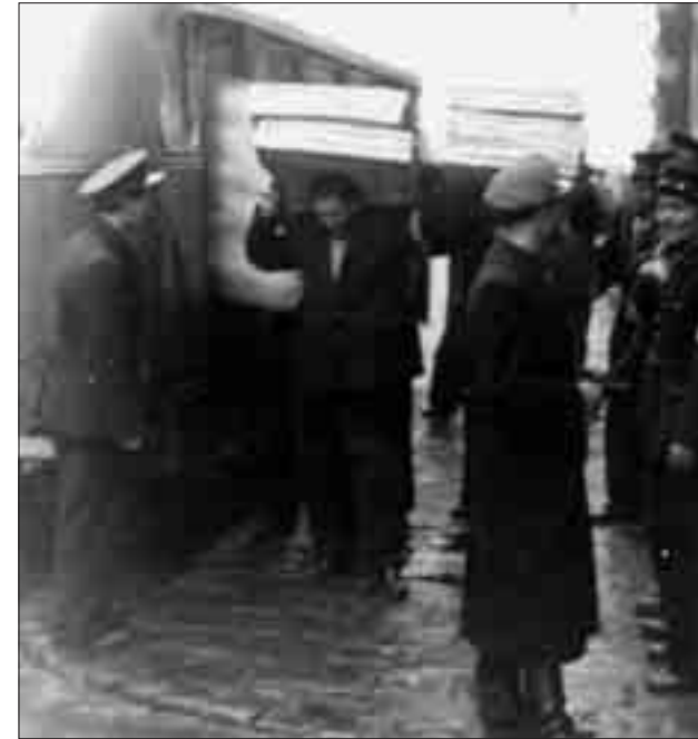
Kórházi felszerelések érkeznek a Pincekórházba