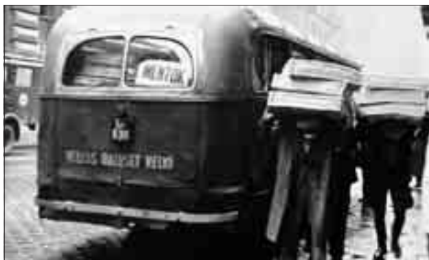
Kórházi felszerelések érkeznek a Pincekórházba

A vidékről Budapestre érkező élelmiszerszállítmányok kerületek közötti elosztását a Fővárosi Tanács VB. Szociálpolitikai Csoportja végezte. A helyi élelmiszerosztást a kerületi forradalmi tanácsok a Magyar Vöröskereszt