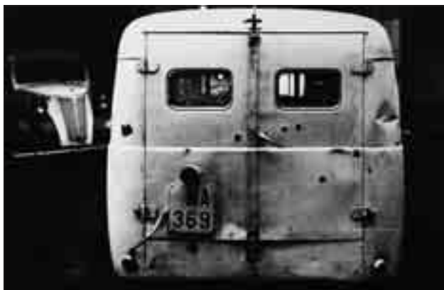
Harcokosi-tűz alá vett mentőautó

A budapesti harcok eszkalálódása során egyre több mentőautót ért támadás, több mentőgépkocsi szovjet katonai járművel ütközött. Az első ilyen kocsi a 999-es háziszámú IFA Garant rohamkocsi volt, mely üzemképtelenné vált még a harcok elején. Kicsépe igen súlyosan érintette a fővárosi betegellátást, mivel ez a rohamkocsi a Központi Mentőállomás egyik legmo-