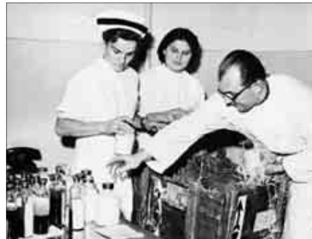
Lengyel egészségügyi szakemberek segélyszállítmányt készítenek elő