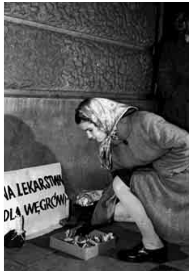
Lengyelek adományokat gyűjtenek gyógyszerekre. (A lengyelek és a magyarok 1956 őszén egyaránt ezt skandálták: „Függetlenség, szabadság, lengyel–magyar barátság”)

meg. Zielona Górában a Lengyel Egyesült Munkáspárt helyi vajdasági (megyei) bizottsága úgy kezdte október 27-i ülését, hogy a résztvevők előbb testületileg elmentek vért adni a magyaroknak. Gyári kollektívák, szakszervezetek, ifjúsági-, egyetemi- és cserkész-szervezetek jelentős pénzüsségeket ajánlottak fel, utcaán kihelyezett kosarakban gyűjtötték a pénzádományokat.