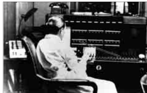
A Markó utcai telefonközpont

Óriási segítséget jelentett az élelmezés megszervezésében a vidéki és a városi lakosság önzetlen adakozása. A mentőknek szánt élelmiszeradomá-