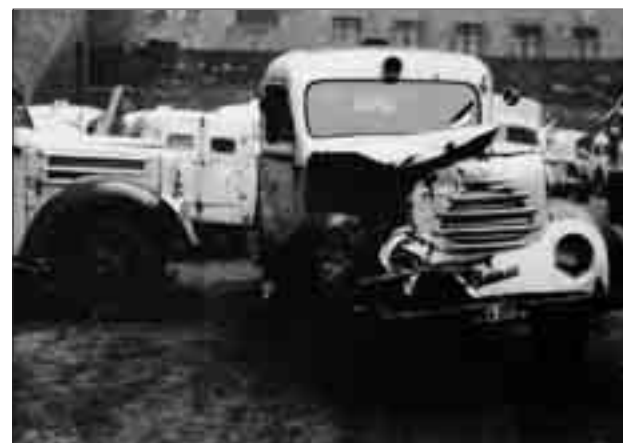
Harci járművekkel karambolozott eset- és rohammentő

derőbb mentőkocsija volt. Orovecz főigazgató rövid rádióközleményben kérte a lakosság segítségét: „Az Országos Mentőszolgálat felkér mindenkit, hogy munkájában a legmesszebbmenőkig nyújtsa segítséget, mert csak ebben az esetben tudja emberbaráti kötelességét gyorsan elvégezni. A sebesültekért kiinduló és a sebesülteket kórházba szállító mentőautók feltűnő jelzésűek és útjuk során a szabad utat minden körülmények között biztosítsák!” 9