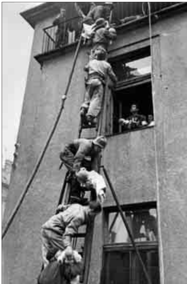
Létrákon mentették az emeletekről a gyermekkorház apróságait

A hallgatók egy része tevőlegesen is bekapcsolódott a fegyveres küzdelembe, de az egyetem és az egyetemi oktatók, hallgatók legfontosabb feladata mégis a mentés és a sebesültek ellátása maradt. Egyedül a Baross utcai II. sz. Sebészeti Klinika 378 sebesültet látott el az október 23. és november 9. közötti időszakban, köztük 37 orosz katonát. A 378 sebesültből 205-en 25 év alattiak voltak. Hasonló időszakban a Tűzoltó utcai II. sz. Gyermekklinikán 80 civilt, 14 felkelőt és 12 szovjet katonát láttak el, majd küldtek tovább sebészeti osztályokra. Az ellátás színvonalával egy odalátogató törzstiszt rendfokozatú szovjet orvos is meg volt elégedve. Az Üllői úton lévő Urológiai Klinikán kb. 170 sebesültet láttak el a harcok alatt, mindössze 4-6 orrossal és az ápolószeméllyel. Az Ortopédiai Klinikáról