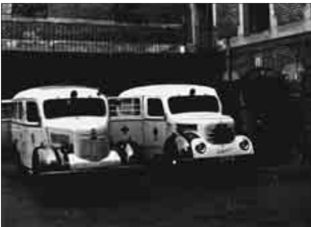
IFA Phänomen roham- és IFA Gazant esetkocsi a Markó utcában

A harci cselekmények sérültjeinek és halottainak adatnyilvántartását, korrekt feldolgozását lehetetlenné tette a beteg-dokumentációk elkallódása, eltűntetése. Tény marad azonban az, hogy az Országos Mentőszolgálat 1956-ban 25 680 mentőfeladattal többet végzett az előző évhez képest. Járműállománya pedig óriási veszteségeket szenvedett.