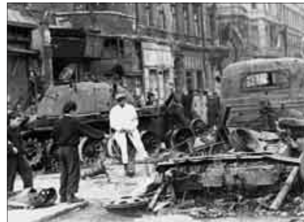
Vöröskeresztes mentők az Üllői úton

Országos átlagot tekintve megállapítható, hogy a harcokban a huszoneves korosztály vett részt a legaktívabban, s így a halálozási statisztikában is e korosztály számaránya a legmagasabb. A meghaltak 22,2%-a 20-24 éves, 17,8%-a pedig 15-19 éves volt. Időpontjukat tekintve a halálozások 43,4%-a október 23 és 31 között, 51,2%-a novemberben, a második szovjet invázió idején történt.