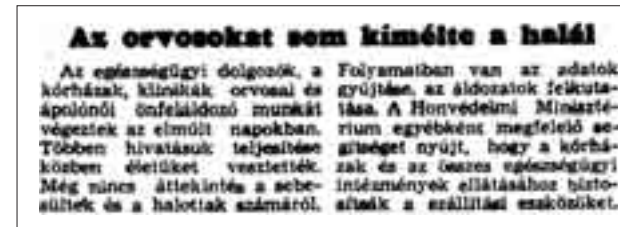
Népszava, 1956. október 28. A cikk főcíme: