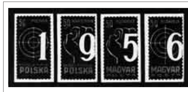
Az 1980-as években illegálisan kiadott lengyel bélyegsor