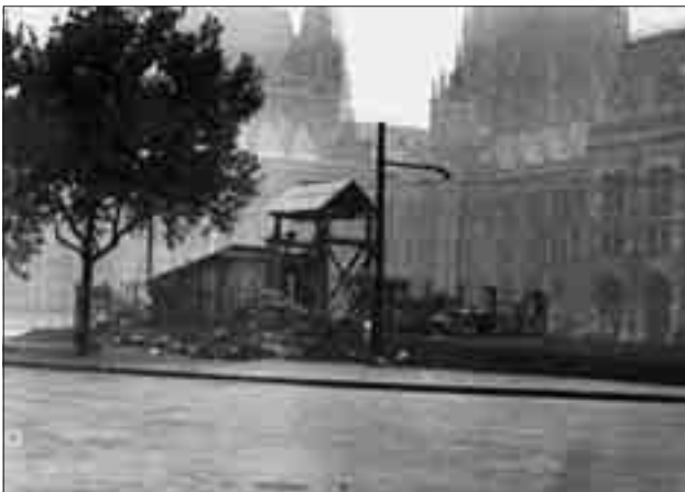
Halottak a Kossuth téren

szaik, kötszereket, kórházi felszereléseket, vért szállított velük. A Vállalat 3 db autóbusszával az önként jelentkező buszsofőrök mentőorvosok és mentőtisztek irányításával keresték fel a tömeges sérülések helyszíneit.