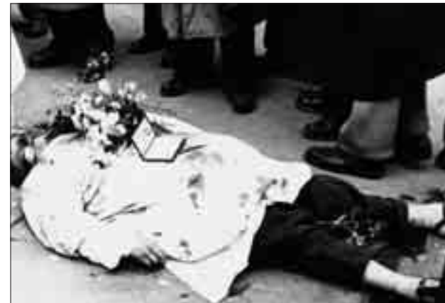
Halott ápolónő az utcán

Ugyancsak az 1980-as évek végén nyílt lehetőség az 1956-os forradalmat követő bírósági perek áldozatainak számszerű megállapítására. Ezeket a pereket évtizedekig olyan titok övezte, hogy még az első hivatalos feldolgozásokban sem hoztak nyilvánosságra adatokat, legfeljebb egy-egy „különösen fontos” perrel kapcsolatban ismertettek közelebbi tényeket. Berecz János 1969-ben megjelent 'Ellenforradalom tollal és fegyverrel 1956' c. könyvében 1956. november 4. és 1957. július 31. között 60 fő kivégzéséről szól, amit az 1989-ben tett nyilatkozatában 244 főre módosított, ezen kívül kb. 400 „köztörvényes” kivégzéséről talált adatokat. Radványi János washingtoni magyar nagykövet 1968-ban 453 kivégzésről kapott tájékoztatást Budapestről. A magyar emigráció felmérései is – Mérey Tibor 1978-ban 2–2,5 ezer, 1989-ben Krassó György kb. ezer személyt számlált– alapos eltéréseket mutatnak. 1989-ben az első levéltári feltárások kb. 400, a pontosítások után 367 fő kivégzését bizonyították, de az 1956-os Intézet által végzett kutatások a bírósági ítéletekre támaszkodva 1956–1959 között 341 halalos ítélet végrehajtását találták bizonyítottnak;