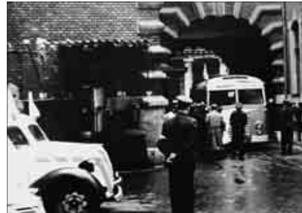
A Markó utcai mentőközpontba lőtt sérülteket szállítanak be