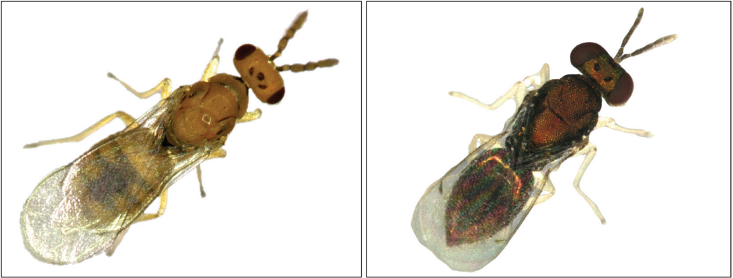
2. ábra: Nőstény parazitoidok: Cirrospilus lyncus (balra) és Chrysocharis orchestis (jobbra) Fig. 2: Female Cirrospilus lyncus (left) and Chrysocharis orchestis (right) parasitoid