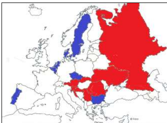
2. számú térképvázlat (Szerkesztette: Dr. Vida Csaba)

A főbb európai és az Amerikai Egyesült Államok nemzetbiztonsági szolgálatait érintő szélesebb vizsgálat mellett meg kell vizsgálni Magyarország nemzetbiztonsága szempontjából releváns országokban működő nemzetbiztonsági rendszereket is, hogy még pontosabb következtetéseket tudjunk levonni a nemzetközi trendek vonatkozásában. Ehhez az országok két csoportját kell elemzés alá venni. Az első csoportba tartoznak azok az országok, amelyek közvetlen hatást gyakorolnak hazánk nemzetbiztonságára. Ezek közé tartozik Ausztria, Szlovákia, Ukrajna, Románia, Szerbia, Horvátország, Szlovénia, valamint Oroszország és az Amerikai Egyesült Államok. (A 2. számú térképvázlaton piros színnel jelölt orszá-