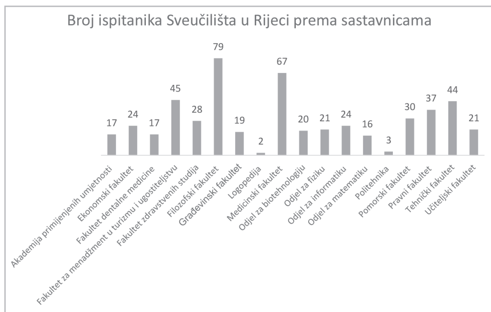
Slika 1. Broj ispitanika Sveučilišta u Rijeci prema sastavnicama Sveučilišta

Ispitanici zaposleni na Sveučilištu u Rijeci mogli su izabrati sastavnicu na kojoj rade. Rezultati su prikazani na slici 1.