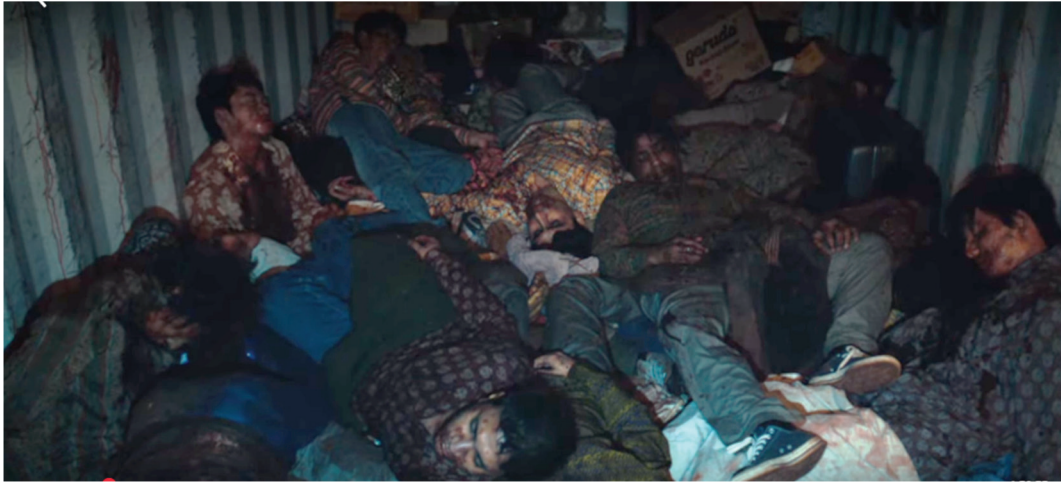
Foto 1. Inicio de la propagación de un virus importado.