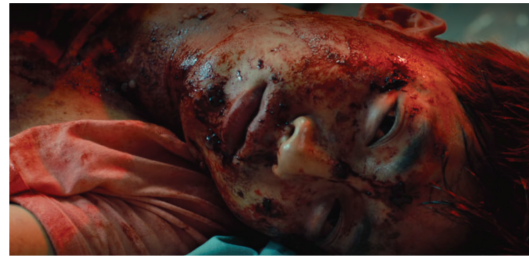
Foto 3. Manifestaciones clínicas de la gripe aviar

se determinó que se trataba de una enfermedad agresiva y el microorganismo causante era el virus H5N1, el cual podría causar la muerte en 3 días, es por ello por lo que se impone a la población permanecer en cuarentena. Las personas entran en pánico por el repentino brote. La policía antidisturbios intenta hacer control inmediato mientras rastrean y tratan de contener a la gente que muestra el contagio, incurren en negligencias, los ciudadanos entran en pánico y caos, llegando incluso a ser encerrados dentro de un supermercado sin explicación.