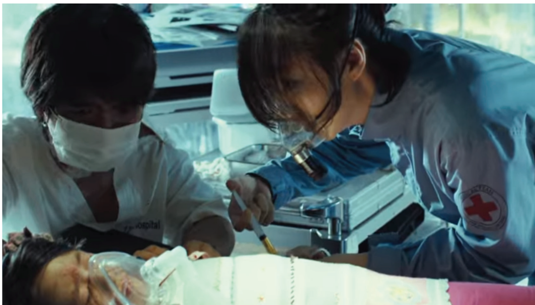
Foto 5. Aplicación de plasma rico en anticuerpos contra el virus.