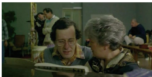
Foto 7. Beryl Alcott reconoce a David Helfgott internado en una institución psiquiátrica.

El carácter de algunas historias puede ser sencillamente maravilloso tanto como el Nulla in mundo pax sincera de Vivaldi c , con que cierra la película.