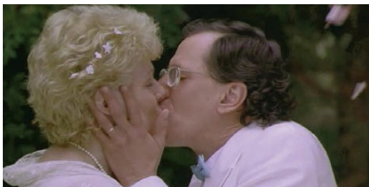
Foto 9. Durante el festejo de la boda.