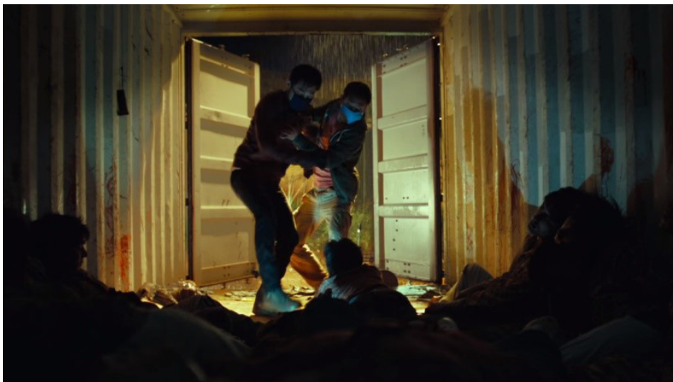
Fotograma 1. Inicio de la epidemia, donde se observa contenedor lleno de cadáveres víctimas de un virus mortal y un sobreviviente.