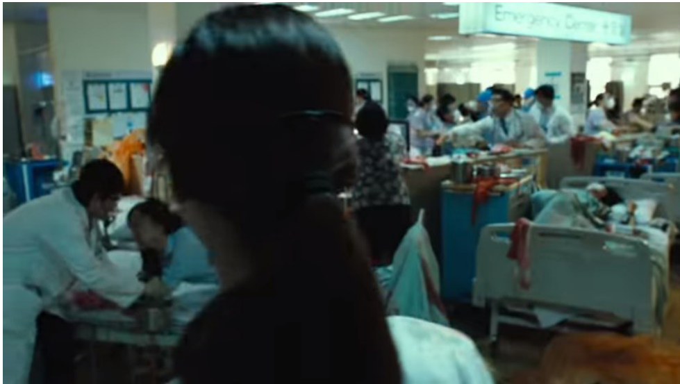
Fotograma 3. Colapso de sistema de salud debido al incremento de casos de personas infectadas con el virus.