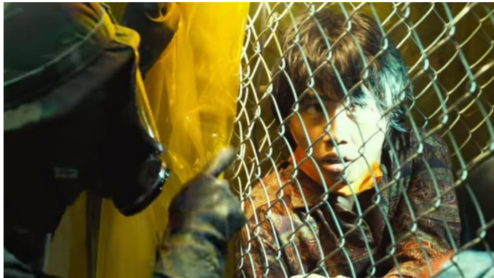
Fotograma 5. Identificación de sujeto inmune al virus.