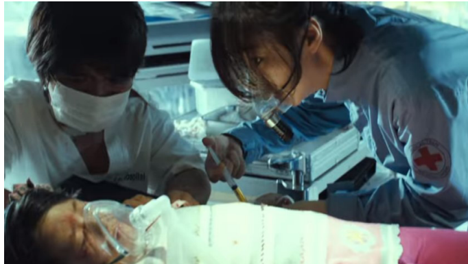
Fotograma 9. Administración de plasma sanguíneo del donador a persona infectada.