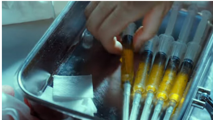
Fotograma 8. Plasma sanguíneo con características inmunitarias del donador.