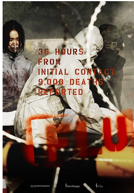
Acción: Seúl (Corea). Época actual. Cartel americano.