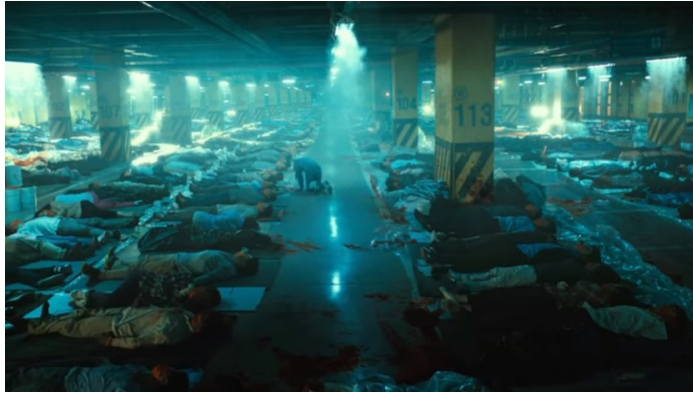
Fotograma 4. Muertes masivas causadas por el virus.