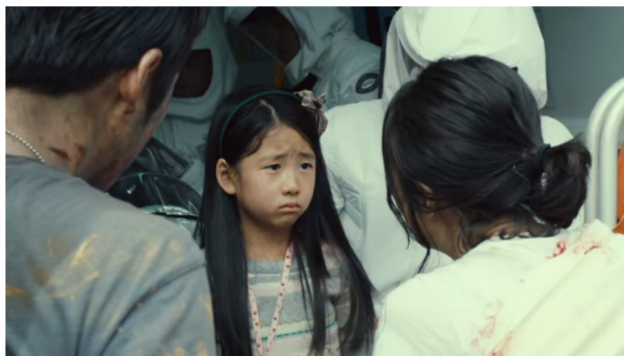
Fotograma 10. Persona en aparente buen estado de salud después de haber recibido terapia de inmunización pasiva.