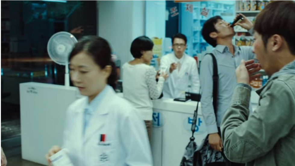
Fotograma 2. Diseminación del virus en entorno social.