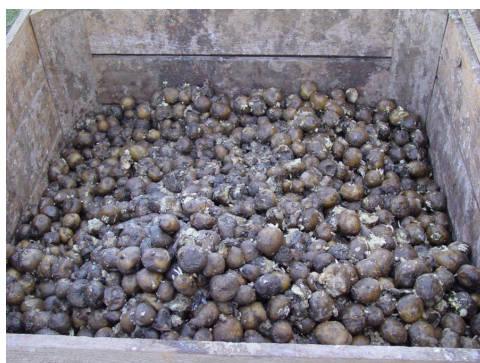
Slika 2. Proces truljenja krtola u uslovima skladištenja prouzrokovano delovanjem vrsta roda Pectobacterium https://www.agric.wa.gov.au/potatoes/soft-rot-diseases-potatoes?nopaging=1