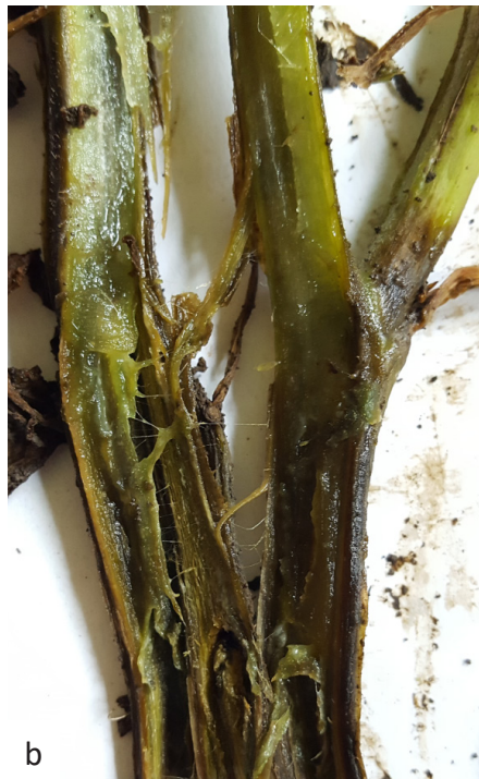
a Slika 1. Simptom truleži prizemnog dela stabla krompira – “crna noga” prouzrokovan bakterijom Pectobacterium carotovorum subsp. brasiliense (Loc, 2019)