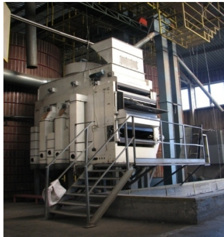
Sl. 1. Grubi čistač (pretčistač)

Mašina koja je bila korišćena za ispitivanje kvaliteta hibridnog semena u doradnom centru Odeljenja za uljane kulture je grubi čistač (pretčistač).