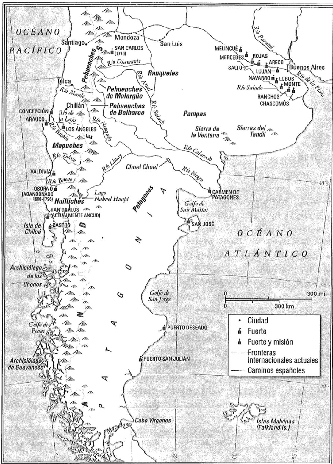
MAPA 2. COSTA PATAGÓNICA Y ARAUCANÍA, FINES SIGLO XVIII.