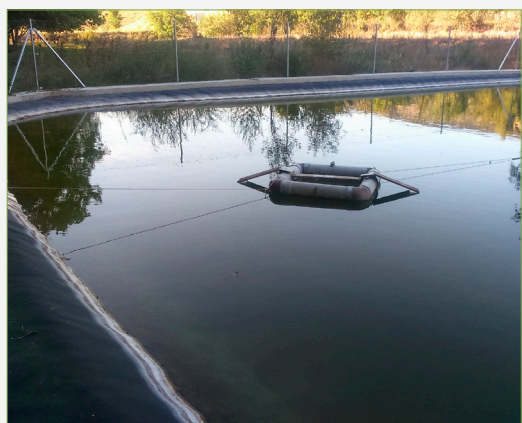
FIGURA 2. Trampa flotant facilitada pel Servei de Vida Silvestre de la Generalitat Valenciana.

La troballa es va donar de forma accidental, en el context dels treballs dels quals s'ha indicat anteriorment per capturar tortugues de rierol en una bassa associada al riu Bergantes, al pas per Morella. Sorprenentment, van caure quatre femelles de gambúsia gràvides en la trampa flotant disposada per a les tortugues. A partir d'aquell moment, es va començar a fer un seguiment més acurat dels peixos i es van poder veure exemplars de diferents grandàries tant a la bassa com al conducte que la connecta amb el riu i al riu