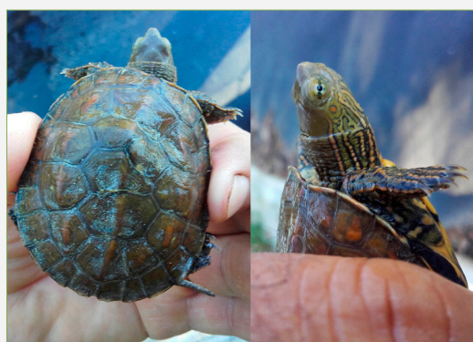
FIGURA 3. Exemplar juvenil de tortuga de rierol ( Mauremys leprosa ). Seguidament va ser alliberat al mateix lloc de la captura (Morella, els Ports).

Floating trap provided by the Wildlife Service of the Generalitat Valenciana.