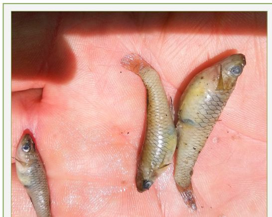
FIGURA 4. Gambúsies ( Gambusia holbrooki ) capturades en una trampa per a tortugues (Morella, els Ports).

La fauna ictiològica del riu Bergantes, un cop es