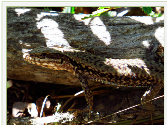
FIGURA 1. Sargantana roquera ( Podarcis muralis ) en un pinar de Vilafranca, a la comarca dels Ports (Castelló).

Si mirem les quadrícules UTM 10 x 10, totes aquestes localitats citades estan dins de YK27 i YK28, que són justament les quadrícules que es troben a l'est de YK17 i YK18 respectivament, que segons dades de la base de dades d'amfibis i rèptils d'Espanya (BDARE, 2020), tenen poblacions confirmades d'aquesta espècie, que