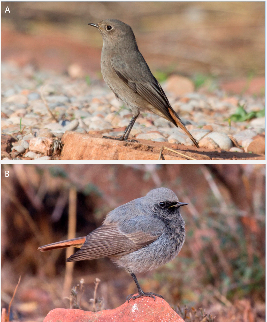
FIGURA 3. A: La gran mayoría de machos jóvenes de colirrojo tizón ( Phoenicurus ochruros ) tienen un plumaje invernal que es indistinguible a simple vista del de las hembras adultas (forma cairii ) (ejemplar de la foto de edad y sexo desconocido). B: Tan solo un pequeño porcentaje de jóvenes muestran un plumaje avanzado de tipo adulto (forma paradoxus ), en la muestra de este trabajo un 3,5%. En estos ejemplares, las plumas de contorno muestran el patrón típico de los machos adultos, pero las plumas del ala mantienen el diseño de las aves jóvenes.

A: Almost the entire male young population of Black Redstarts ( Phoenicurus ochruros ) have a winter plumage that is indistinguishable from that of an adult female ( cairii form) (sex and age of depicted bird unknown). B: Just an small percentage of first year birds show an advanced adult-like plumage (form paradoxus ), a 3,5% in this work's sample. In these birds, contour feathers show the typical adult-like pattern, but flight feathers retain juvenile design.