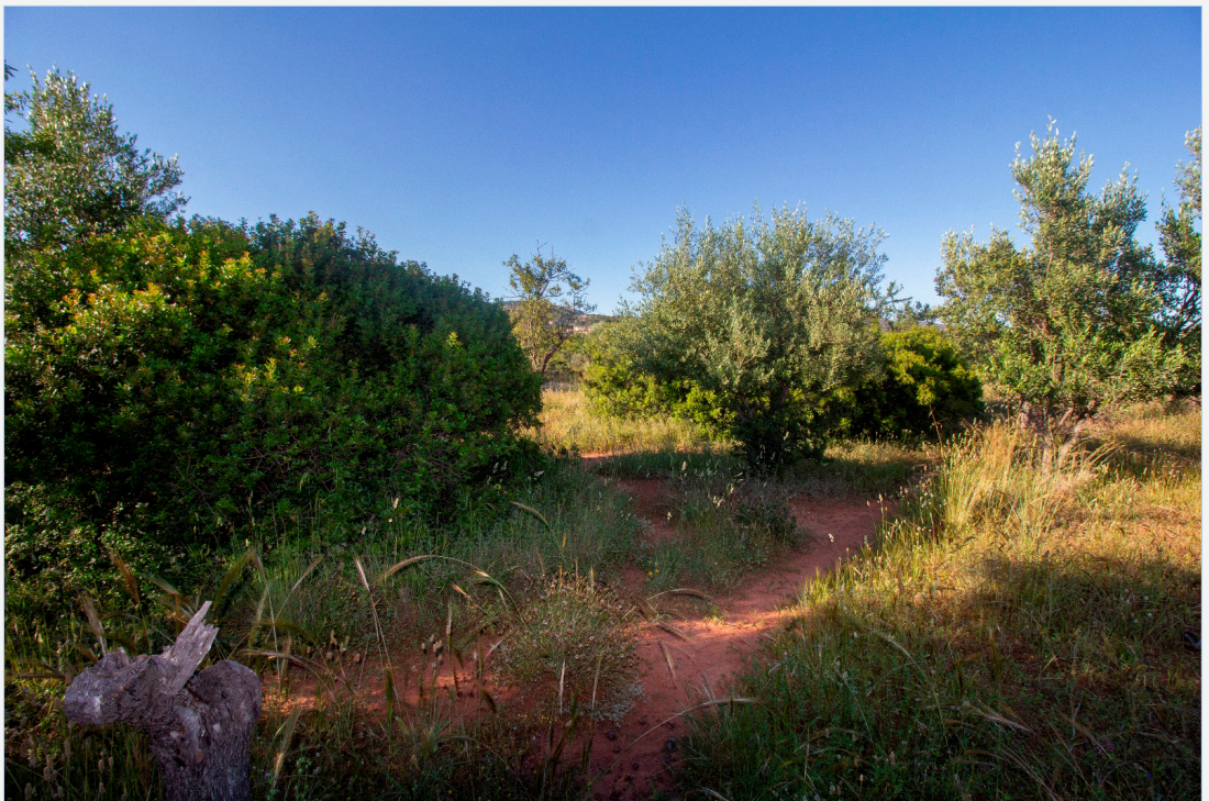
FIGURA 1. El área de estudio es un antiguo campo de almendros abandonados en los que la vegetación natural es ya dominante. Entre las especies de plantas más importantes en el área destacan el olivo silvestre ( Olea europaea var. sylvestris ) y el lentisco ( Pistacia lentiscus ).

A pesar de su interés como una de las especies presaharianas más comunes en el levante ibérico en invierno, los estudios sobre su invernada en esta zona son inexistentes. En este trabajo se estudia el colirrojo tizón a través del marcaje de ejemplares y de la realización de censos, para describir su migratología y su estrategia invernal. Se estudian algunos parámetros básicos de la invernada, como la proporción de edades y sexos en los distintos periodos de su presencia en el área, su tasa de retorno interanual y la evolución a lo largo de 14 temporadas de las fechas de llegada y salida y de sus densidad numérica en una pequeña parcela de la Plana de Castellón.