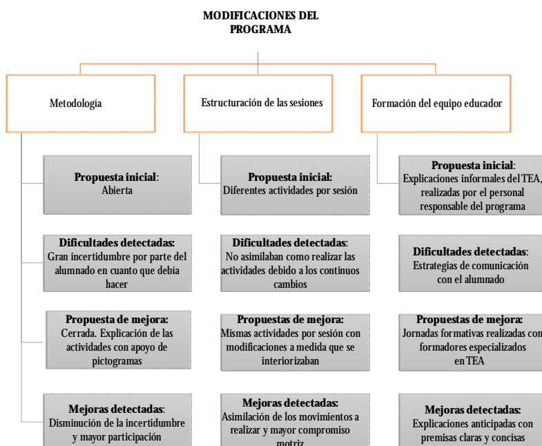
Figura 2. Principales modificaciones y mejoras del programa.

Se optó por virar hacia una metodología cerrada y menos divergente, en la que aumentó el control del equipo educador sobre el desarrollo de las actividades, que también se volvieron más concretas. Así como, incidir y aumentar el canal de comunicación visual dentro de las explicaciones de las actividades. Por un lado, se introdujeron recursos de sistemas aumentativos y alternativos de comunicación, concretamente pictogramas. Prácticamente la totalidad del alumnado participante había trabajado en algún momento de su vida con este recurso por lo que fue fácil introducirlos dentro de la