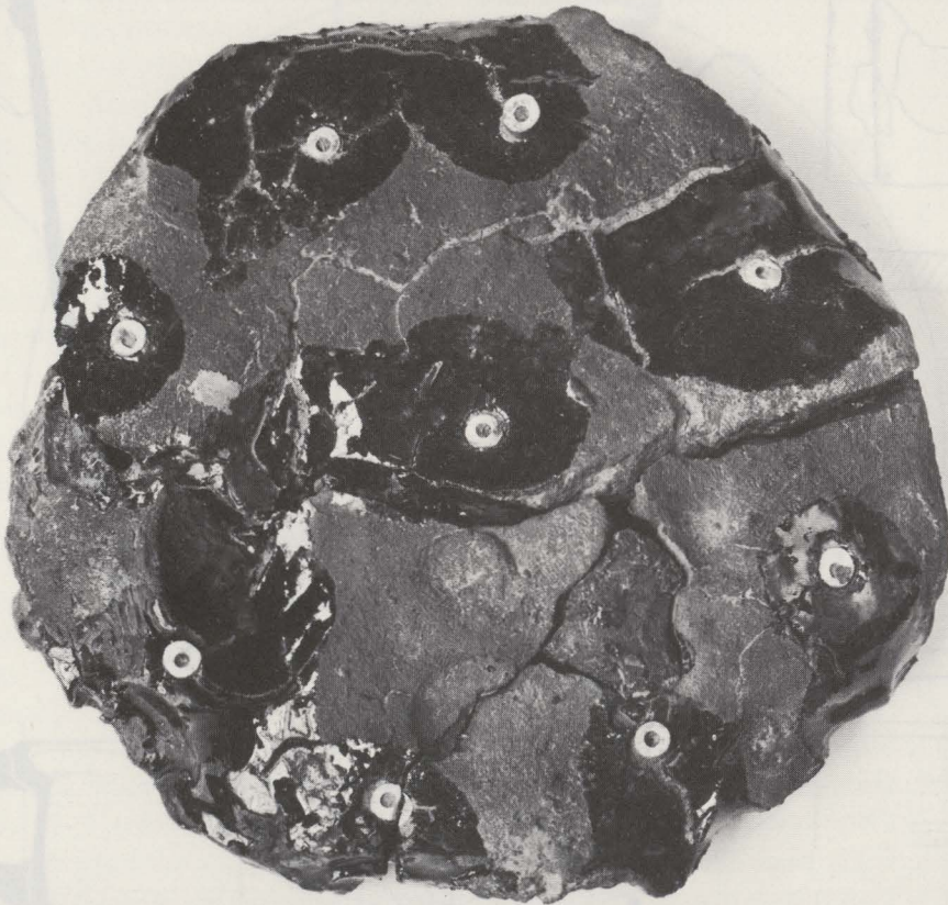
Fig. 103. 'Potbodem' met afgebroken pijpestelen.

tijdens het transport van de pijpenpot naar en van de oven. Soms waren deze ringen ook voorzien van een herkenningsteken of het merk van de pijpenmaker. In tegenstelling tot de in Gorinchem ontdekte handgevormde pijpenpotten in witte klei, zijn de fragmenten uit Bilzen in rode klei uitgevoerd, en voorzien van een standring waarin zich verschillende verluchtingsgaten bevinden. Bovendien zijn er geen sporen aanwezig van een haspel waartegen de pijpen opgestapeld werden ( 56 ). Tenslotte merken wij op dat de pijpen in dit geval met de kop naar boven en met de steel naar onder in de pot gestapeld werden. Hiervan getuigen niet alleen de afgebroken steelfragmenten in de potbodem ( 57 ), maar ook de daarop afgelopen loodglazuurvlekken.