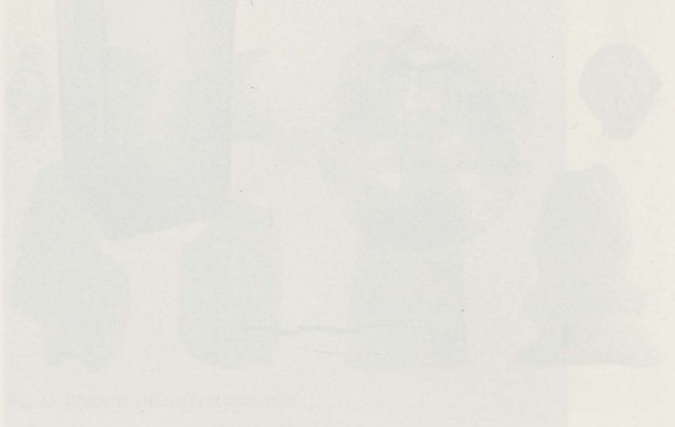
Fig. 23. Statuettes votives en terre blonde.

Les statuettes étaient en terre blonde et avaient une hauteur comprise entre 4 et 6 cm. Elles étaient généralement en forme de personnages ou d'animaux. Les fragments étaient généralement dispersés dans la fosse.