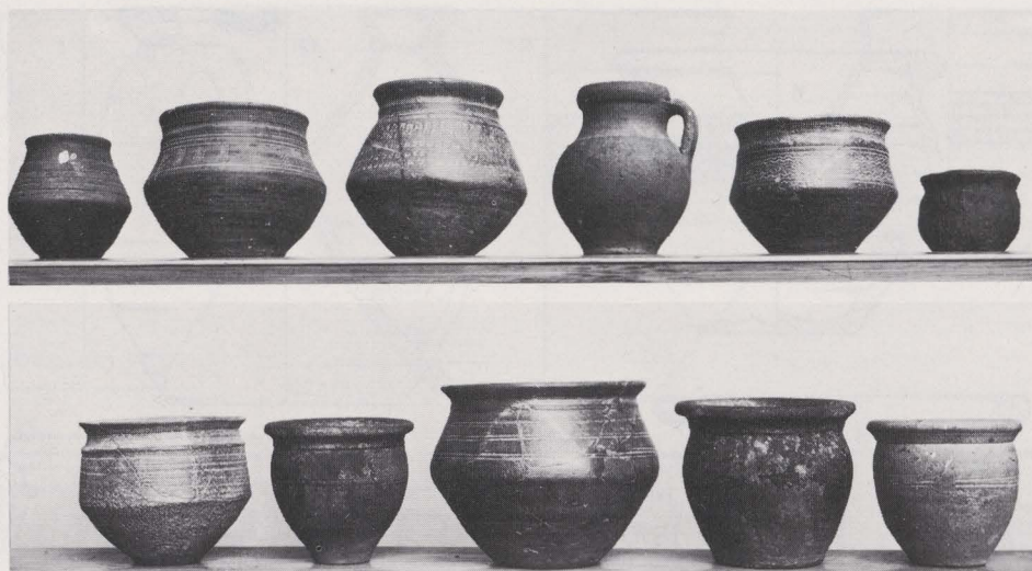
Fig. 3. De keramiek.

vanaf de 2de helft der 6de tot het eerste kwart der 7de eeuw of later te dateren 9) .