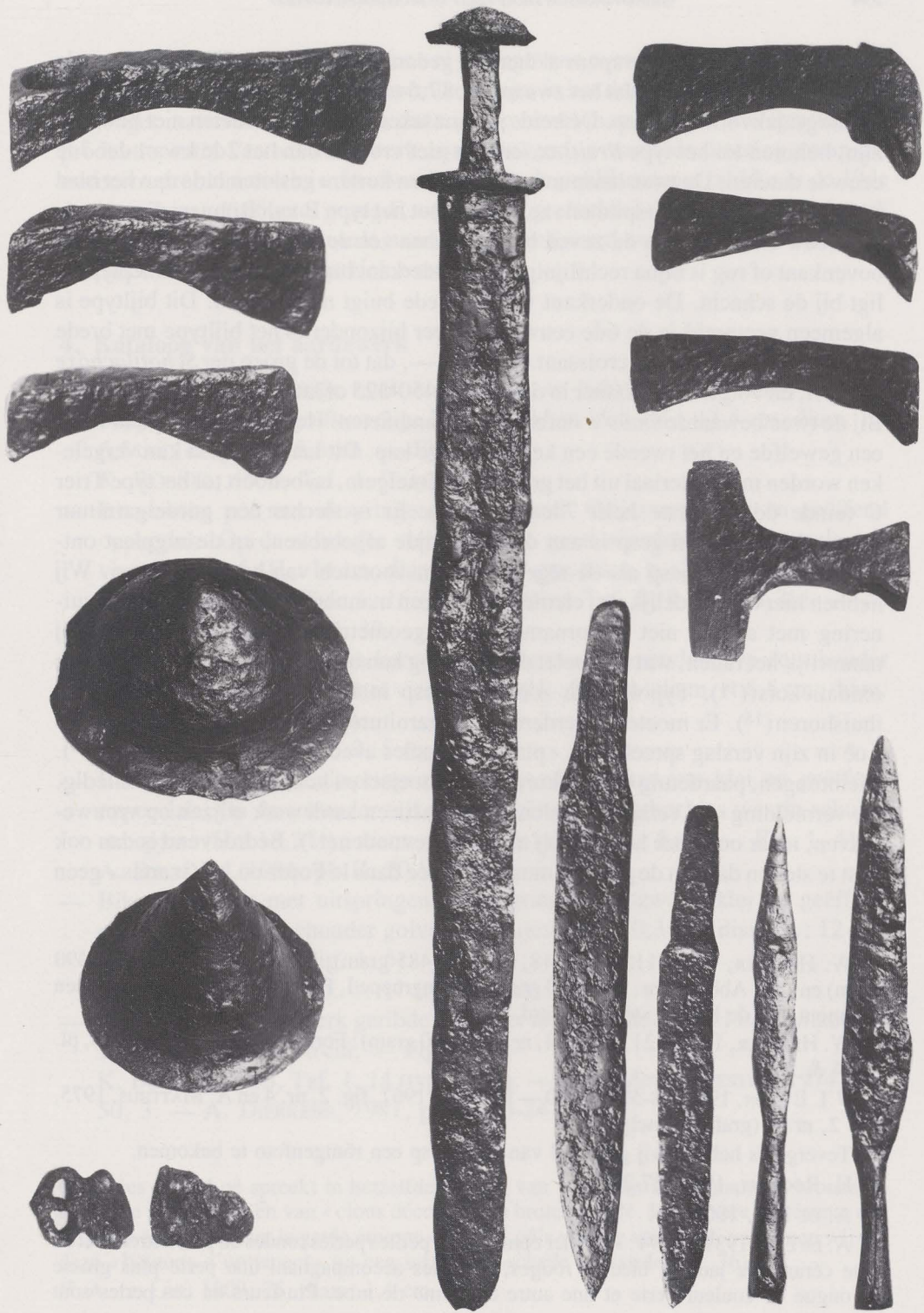
Fig. 4. Zwaard, lanspunten, scramasaxen, francisca's, umbo's en gordelgarnituur.