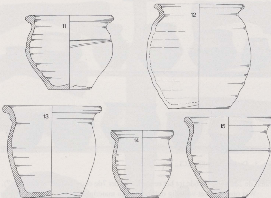
Fig. 2. Keramiek. S.1/3.

te Brussel, waar het zich thans nog gedeeltelijk bevindt (8) . De vondsten kunnen onderverdeeld worden in keramiek en metaal. In het totaal worden er thans vijftien op de draaischijf vervaardigde potten bewaard. Er moeten er echter enige meer geweest zijn, vermits op een ACL-foto (fig. 3) drie urnen (waaronder een handgevormd potje) worden afgebeeld die wij niet weervonden. Wij veronderstellen dat deze objecten niet zozeer verloren gingen, maar met ander Merovingisch materiaal in het Brussels museum vermengd of verwisseld werden.