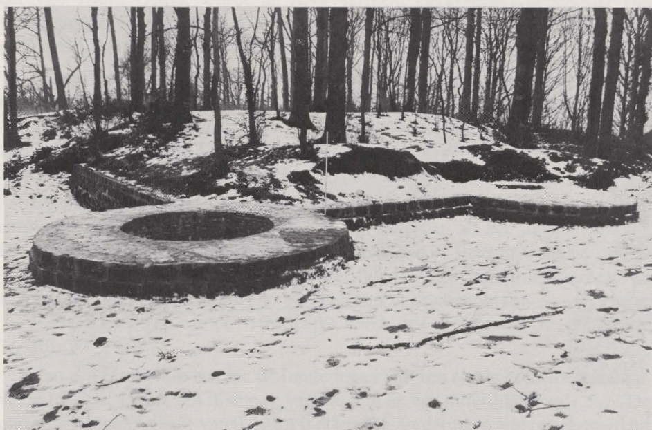
Fig. 71. De geconsolideerde zuidoostelijke hoek van het kasteel.

Tot deze bouwfase behoort ook de oostelijke buitenmuur van het kasteel die reeds in 1959 gedeeltelijk was onderzocht. De zuid-oostelijke hoek werd volledig vrijgelegd waarbij twee ronde torens op een zware veelhoekige fundering te voorschijn kwamen. Op de hoek bevond zich een holle toren met kelderverdieping die op amper 4 m werd geflankeerd door een tweede volle toren. Vanuit de hoektoren liep een muur westwaarts die na ca. 10 m plots eindigde. Een analoge situatie vertoonde de noord-oostelijke hoek zodat de oostelijke buitengevel een symmetrisch geheel vormt met vier torens. Het zuidelijk deel hiervan werd geconsolideerd en gerestaureerd (fig. 71). Waarschijnlijk dateert deze bouwfase uit het midden van de 15de eeuw.