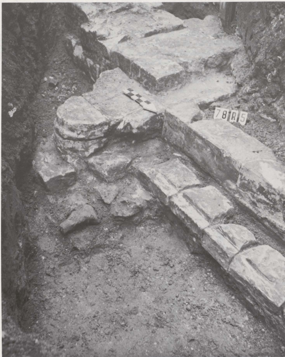
Fig. 106. Pijlerbasis van de zuidelijke muur van de middenbeuk.

Muur 3 is gevormd door twee rijen gezaagde mergelblokken in een kalkmortel ingezet, die aangebracht is op de bovenkant van de funderingsmuur 2; staat los van muur 5.